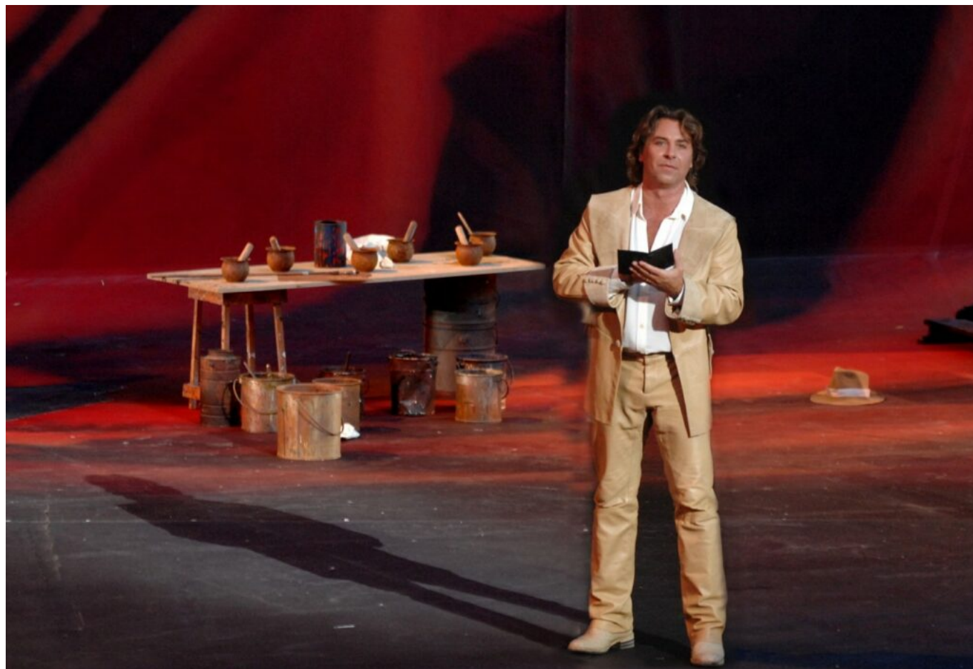
Roberto Alagna dans Tosca.