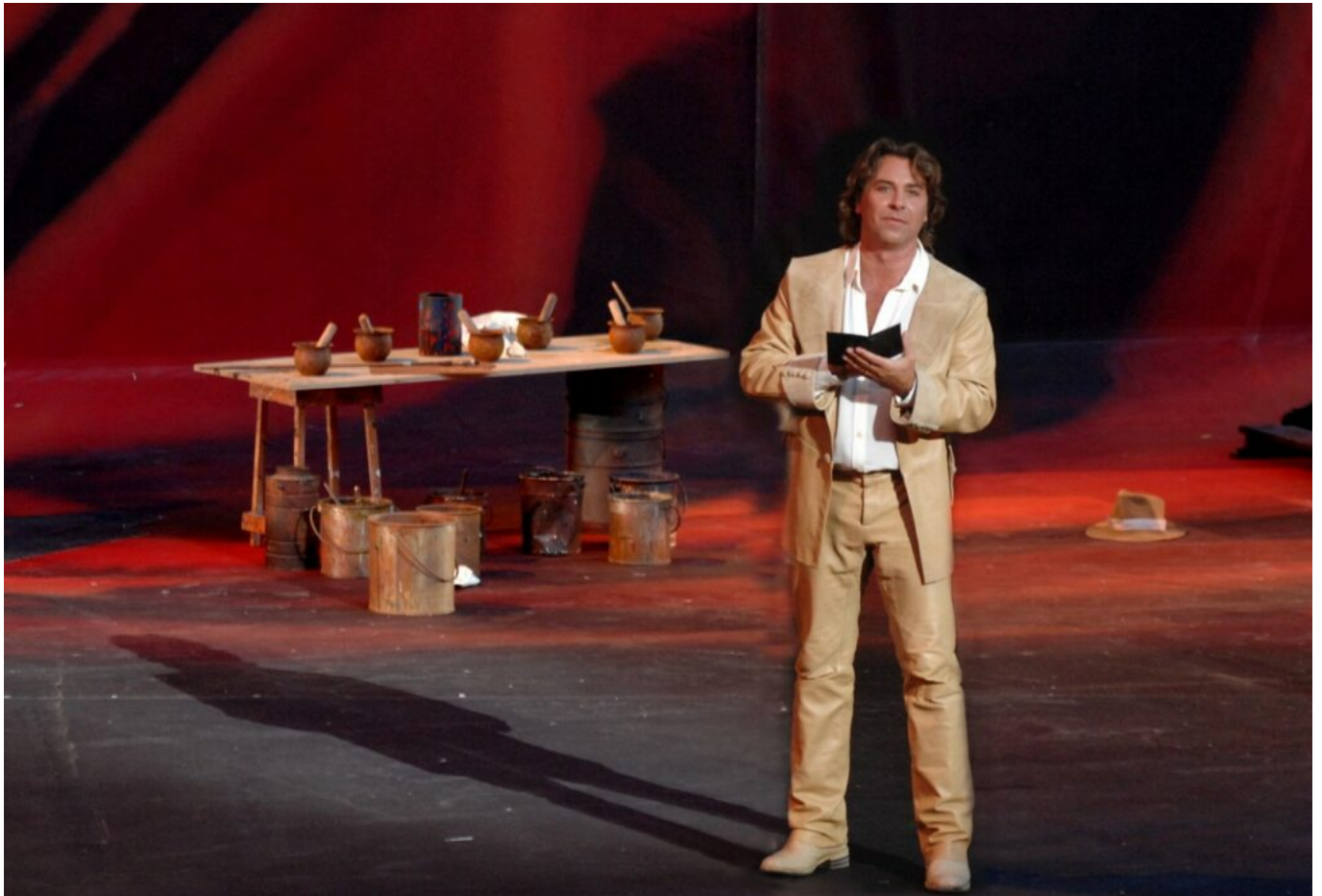
Roberto Alagna dans Tosca.

Que de tenors et baryton ont mis le feu aux gradins : Luciano Pavarotti, Plácido Domingo, José Carreras, Leo Nucci, José Van Dam, Ruggero Raimondi, Roberto Alagna, Rolando Villazón, Alain Fondary, Gabriel Bacquier, Vittorio Grigolo, Juan-Diego Flores, Giacomo Aragall, Jonas Kaufmann.