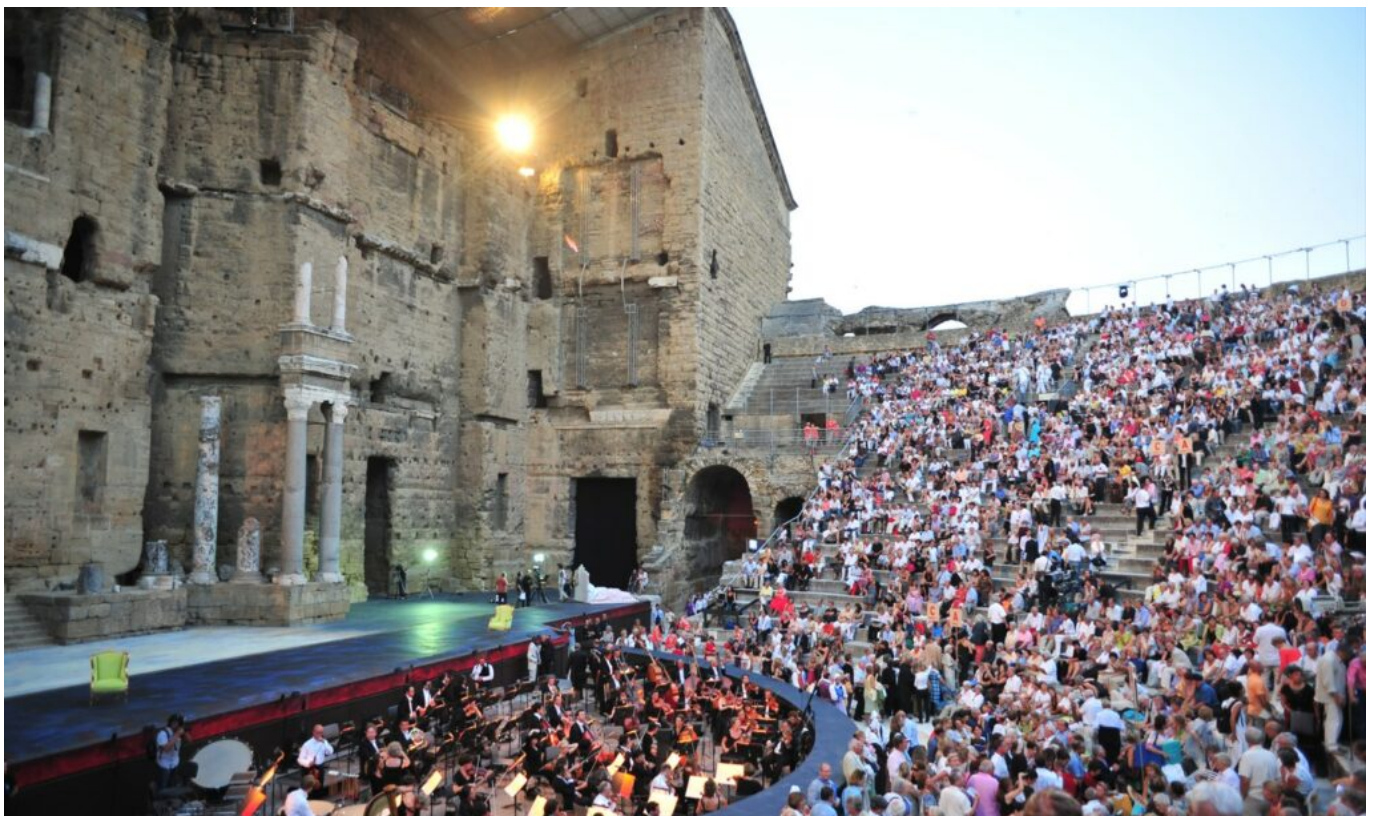
Les spectateurs de la Traviata en 2019.

Parmi les constats de la CRC : « Une fréquentation atone et sans aucune mesure avec la capacité d'accueil du Théâtre Antique, une absence de projet stratégique partagé, une surestimation chronique et systématique des recettes, des procédures de passation des marchés entachées d'importantes irrégularités puis'aucune dépense n'a fait l'objet d'une procédure de marché public ».