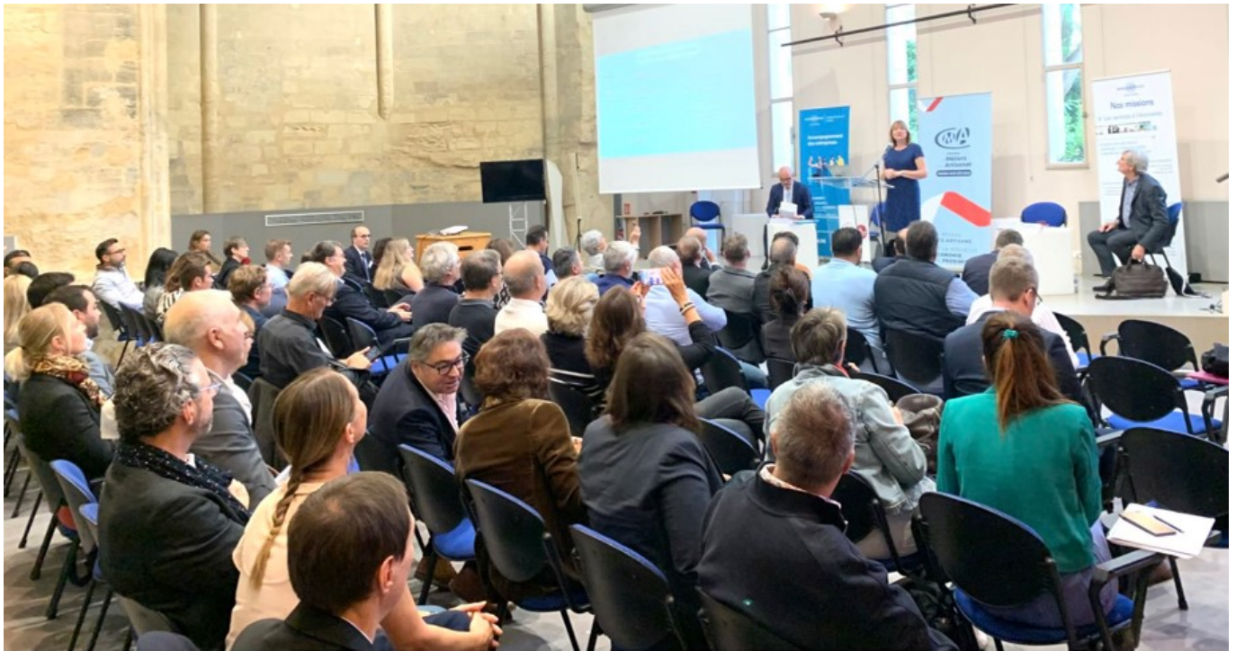
Le monde économique réuni lors de cette présentation de la banque de France