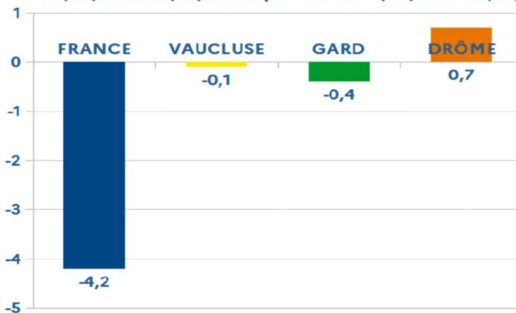
% EVOLUTION COMMERCE EXTERIEUR Evolution en % des exportations et livraisons intra-communautaires du 01/07/23 au 30/06/24 à la période du 01/07/22 au 30/06/23

de chiffres en baisse : -12,9% de construction de logements neufs, -6% d'activité dans les travaux publics, - 16% d'appels d'offres. Mais « Il faut garder l'espoir, le moral. Les prêts à taux zéro ont progressé de 28%, la production de béton prêt à l'emploi a augmenté de 3% (371 740m 3 ), le montant des appels d'offres travaux a grimpé de +6,9% (soit 690M€). Donc ne baissons pas les bras, continuons à former des jeunes, à transmettre nos métiers. Nous réhabilitons des logements anciens, nous faisons de la rénovation thermique pour que les appartements et les maisons ne soient plus des passoires, nous travaillons aussi sur les conduites et canalisations d'eau avec les grands donneurs d'ordres (Veolia, Suez) pour qu'il y ait moins de fuites. En ce moment il y a le chantier de la future prison d'Entraigues, de la déviation de la Nationale 7 à Orange, du réaménagement du carrefour de Bonpas. Que les élus des mairies, des communautés de communes et du département de Vaucluse continuent à nous faire confiance. Nos concitoyens ont besoin d'un toit, de crèches, d'écoles, de collèges, de lycées pour leurs enfants, de commerces, de lieux de culture et de loisirs, de routes. Nous n'avons pas le droit d'être pessimistes ».