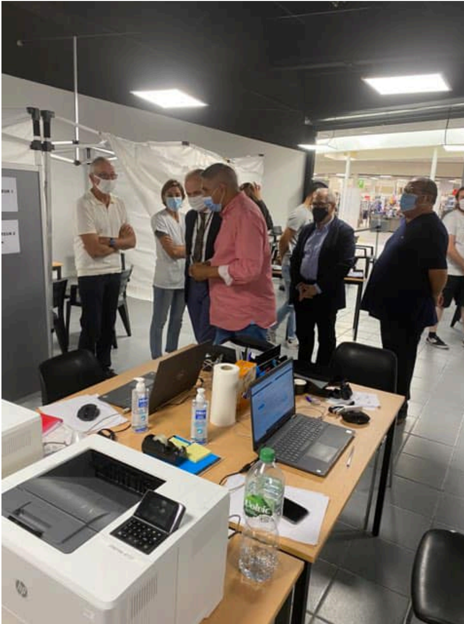
Inauguration du nouveau centre de vaccination à Carrefour Courtine.