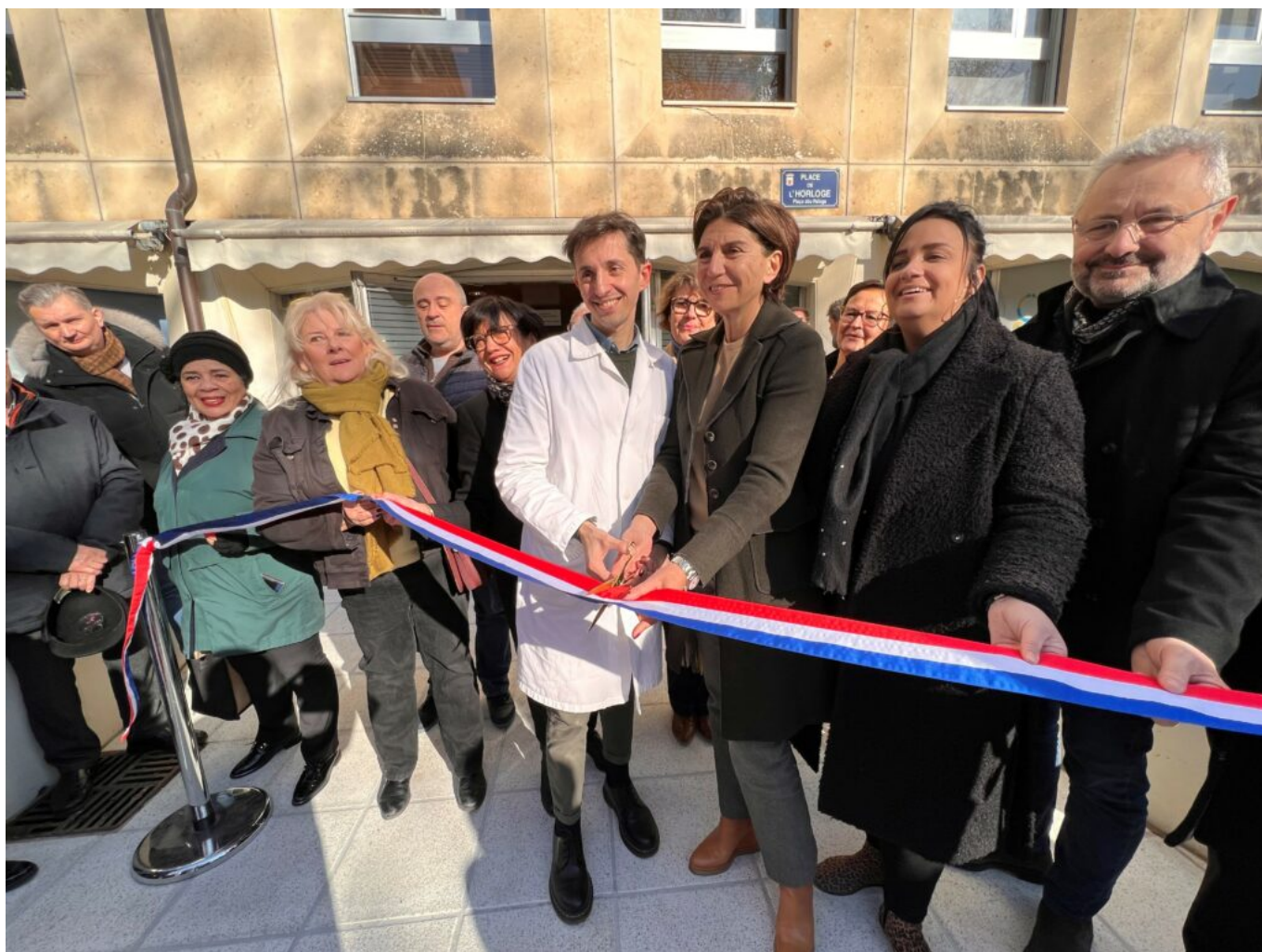
Inauguration du centre du Réseau Départemental de Santé, nouvellement ouvert place de l'Horloge à Avignon.

Il poursuit : « Ici, je vais pouvoir me concentrer sur le patient, le suivre dans la durée, avec une prise en charge globale comme médecin traitant. Je travaille du lundi au vendredi de 9h à 18h, après je vais gérer ma vie privée comme je l'entends, profiter des paysages, des randonnées, des loisirs, de la vie culturelle, du climat du Vaucluse ».