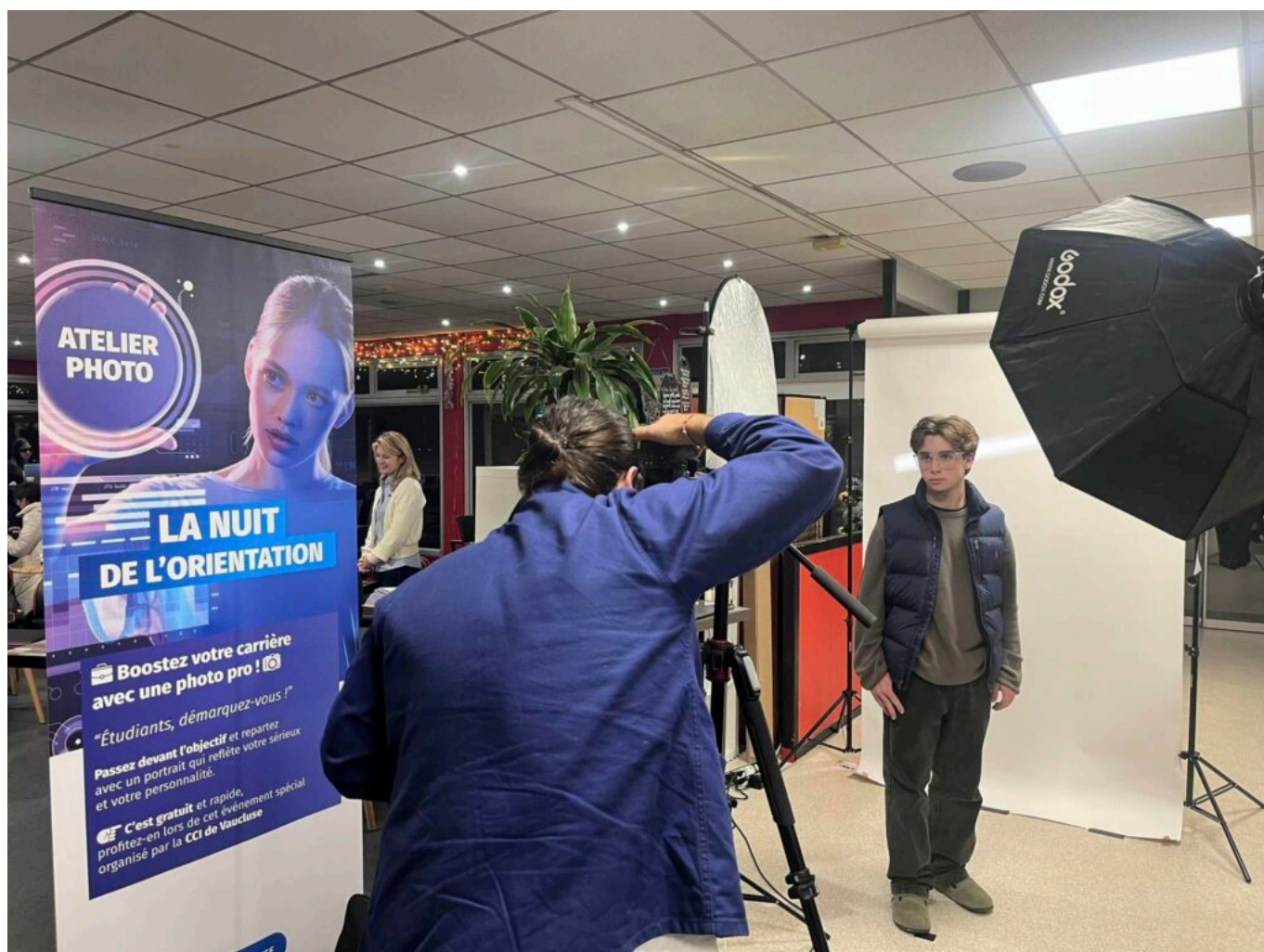
L'événement a permis de renouveler les photos pour les CV.