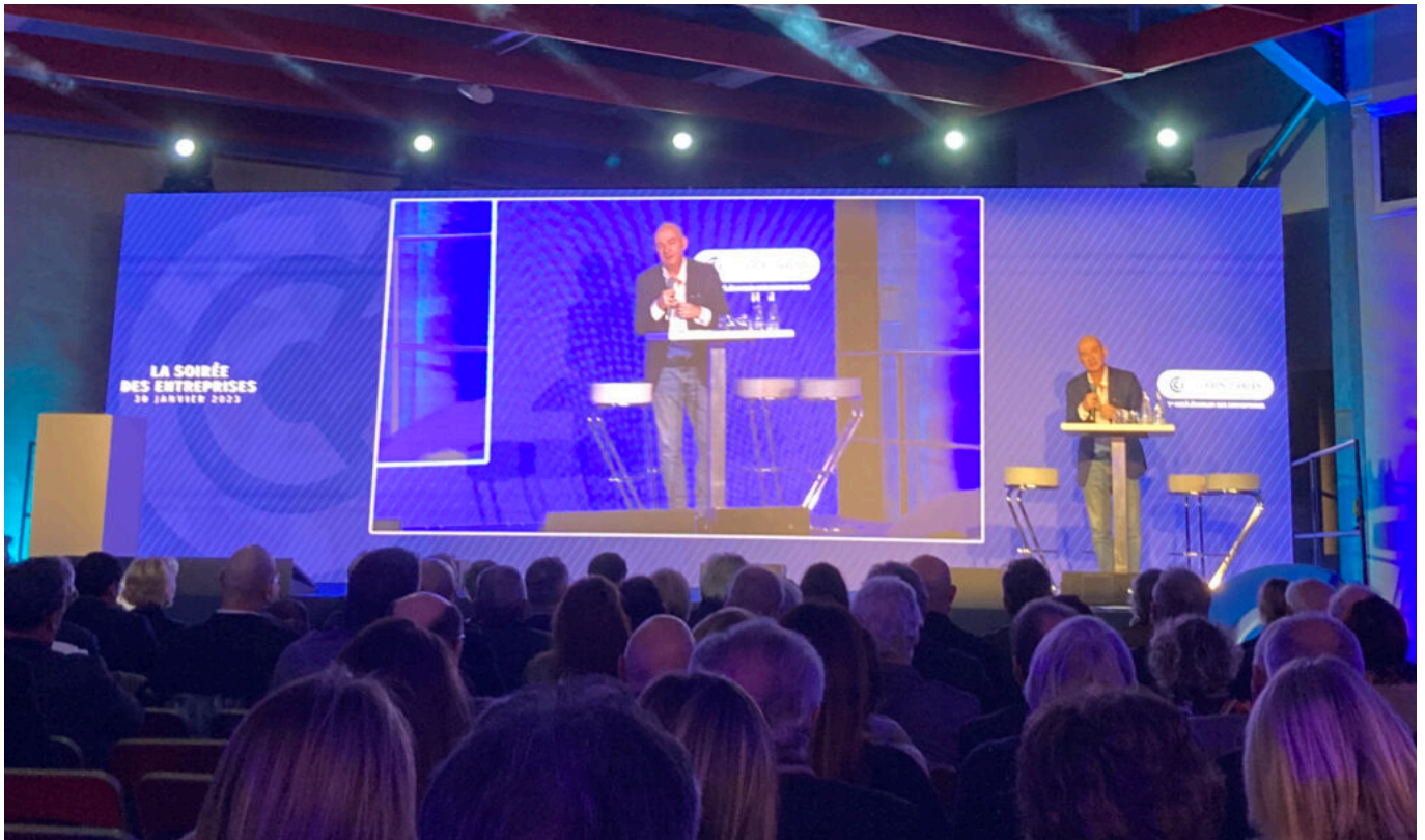
François Lenglet