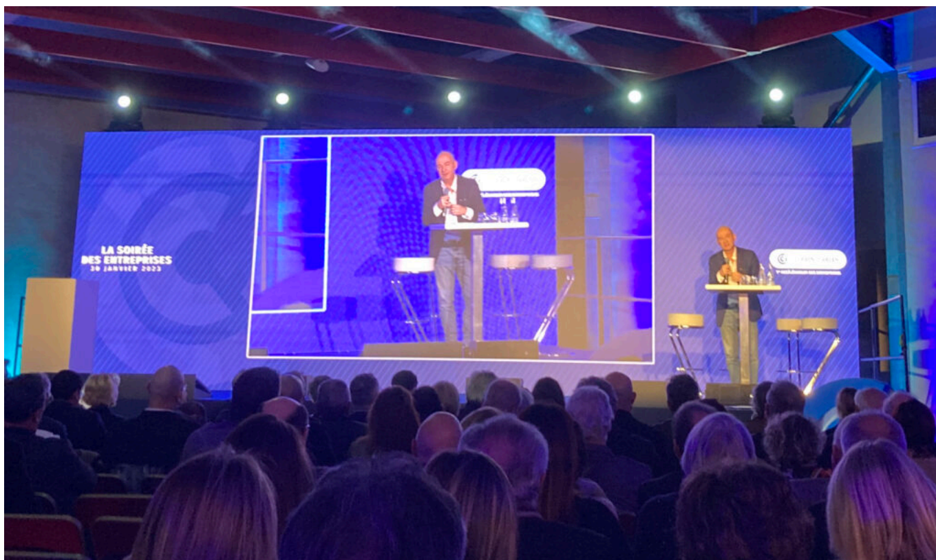
François Lenglet