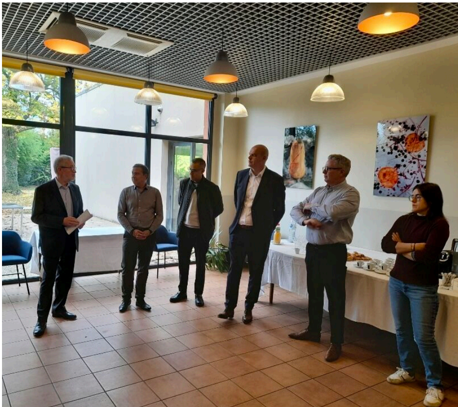
Le lancement officiel de la première session du Campus Pyro à Avignon.

« Cette ouverture représente une belle synergie entre les besoins d'industriels du secteur pyro et le campus », se félicite le Campus Pyro également ravi de l'accueil de la CCI 84.