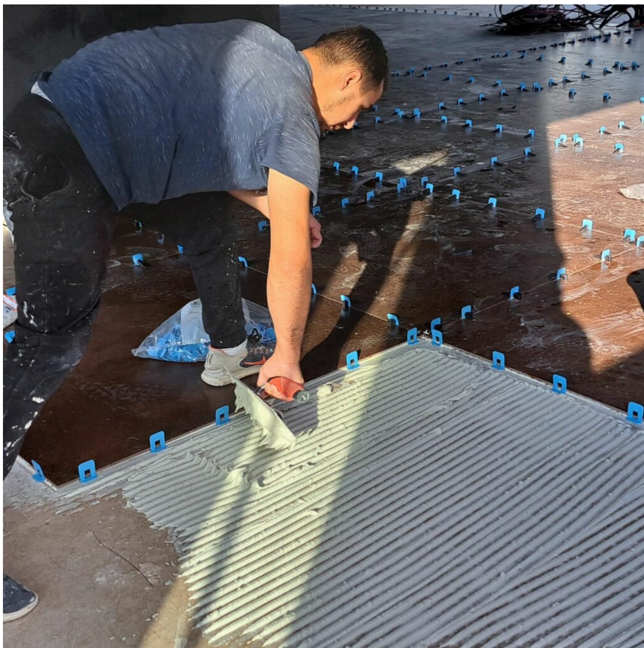
Pose du carrelage