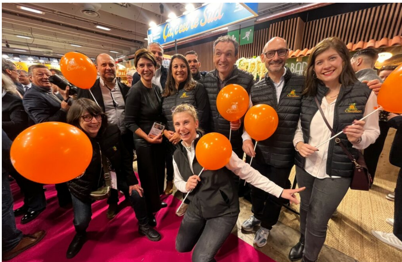
La présidente du Conseil départementale de Vaucluse avec les producteurs de melon de Cavailon.

« Grâce à l'agriculture et à la viticulture, nous avons de magnifiques paysages qui attirent les touristes du monde entier. »