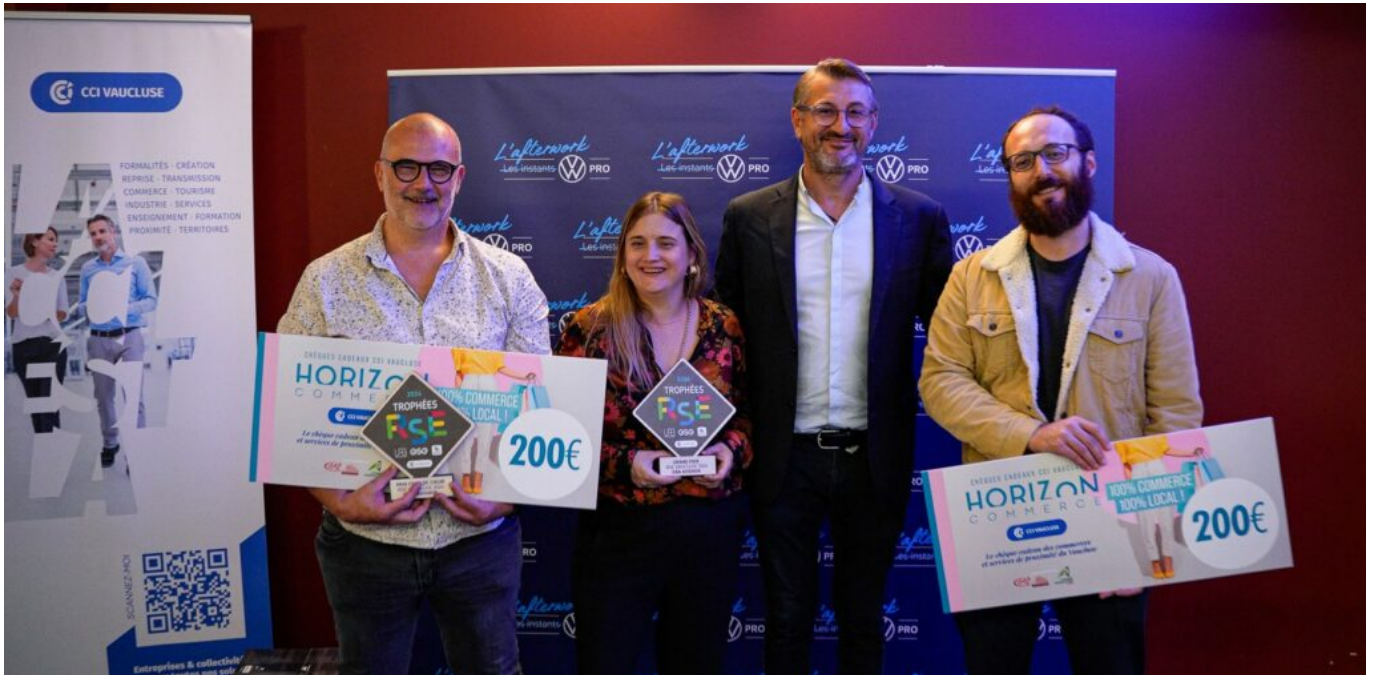
Les lauréats vauclusiens des prix RSE Vaucluse 2024.

Dans ce cadre, le chercheur met en lumière les défis de santé spécifiques aux entrepreneurs car si l'entrepreneuriat est souvent source de satisfaction, il comporte également des risques importants comme le burn-out, le stress et des problèmes de santé chroniques.