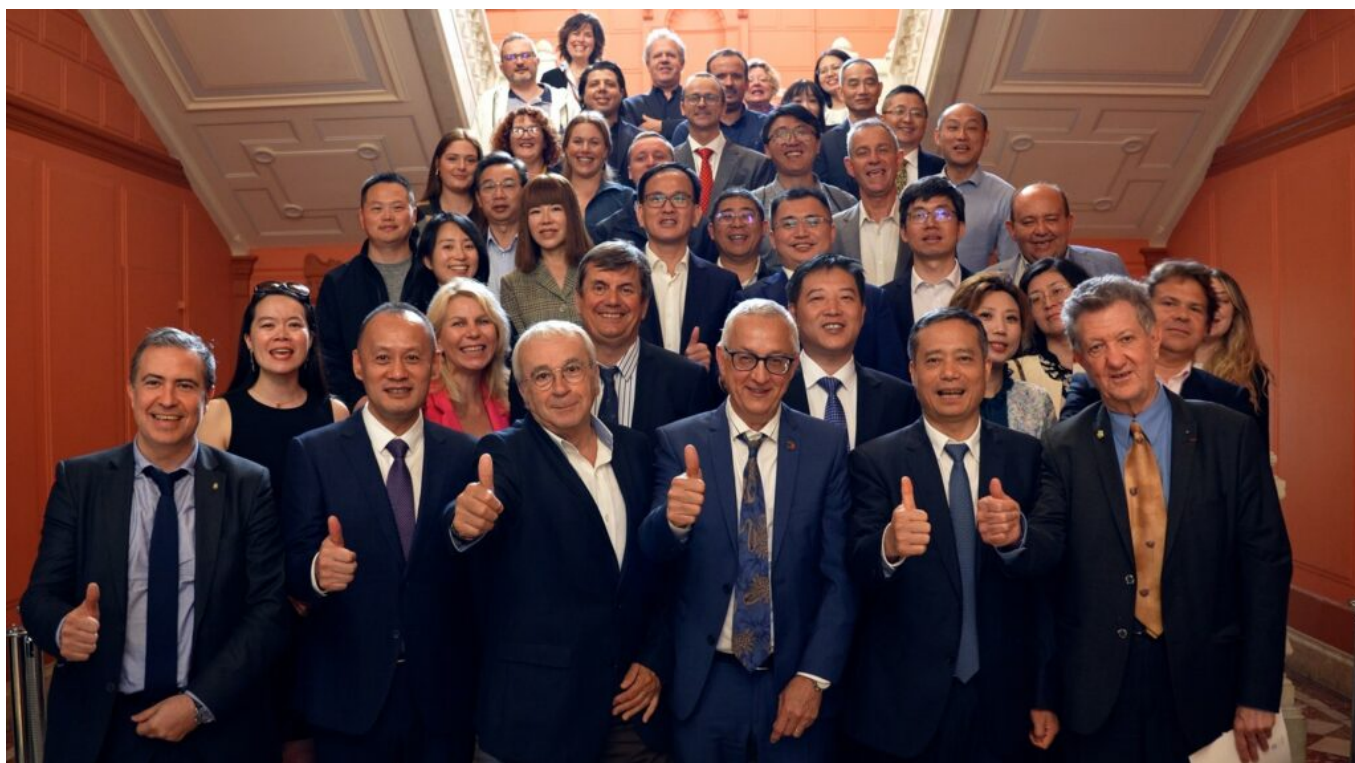
La délégation chinoise de Shenzhen lors de sa visite à la CCI de Vaucluse en octobre dernier.