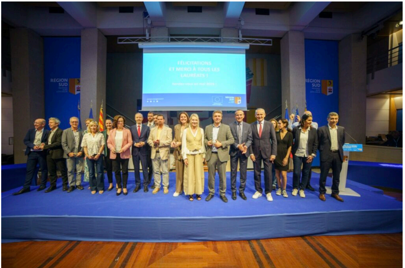
Les lauréats.

Parmi les lauréats cette année, on compte notamment l'exploitation Saint Félix, basée à Cavaillon, qui est arrivée en haut du classement pour la catégorie 'Biodiversité'. Son projet, qui a aussi reçu le Prix spécial du jury, se base sur l'acquisition et l'installation de filets mono-rangs anti-insectes sur ses pommiers, afin de protéger les cultures sans avoir recours aux pesticides, tout en préservant la biodiversité. Le projet présente d'autres avantages tels que la réduction des traitements, de la consommation d'eau, des passages de tracteurs et donc leurs émissions de gaz à effet de serre.