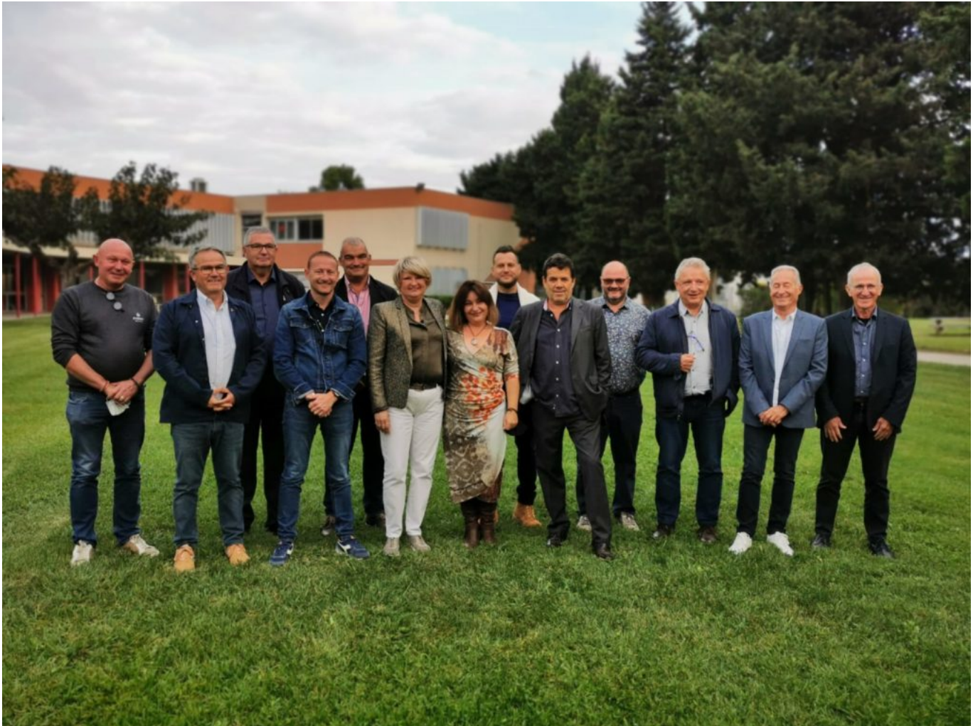
Président, conseil d'administration et direction du Geiq 84