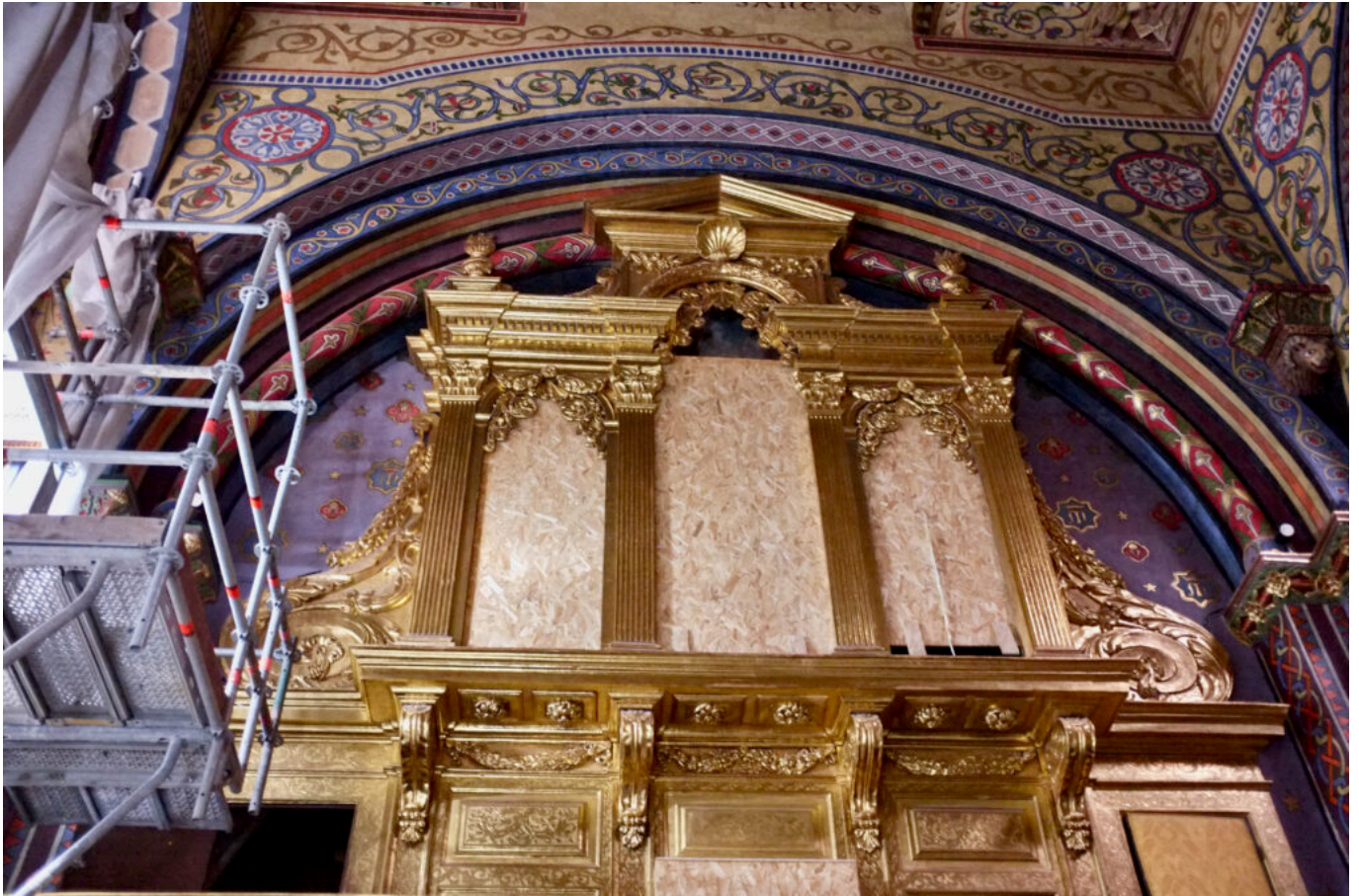
le cœur ©DB