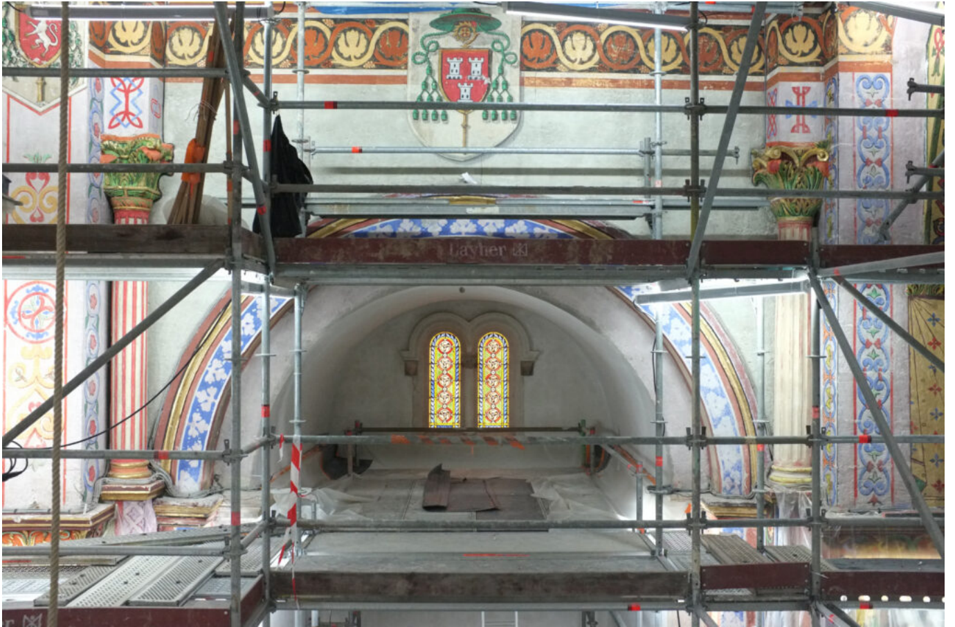
mur peint