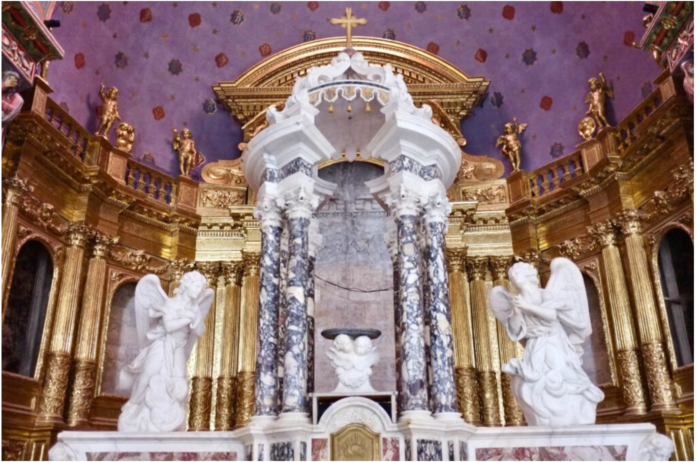
le retable