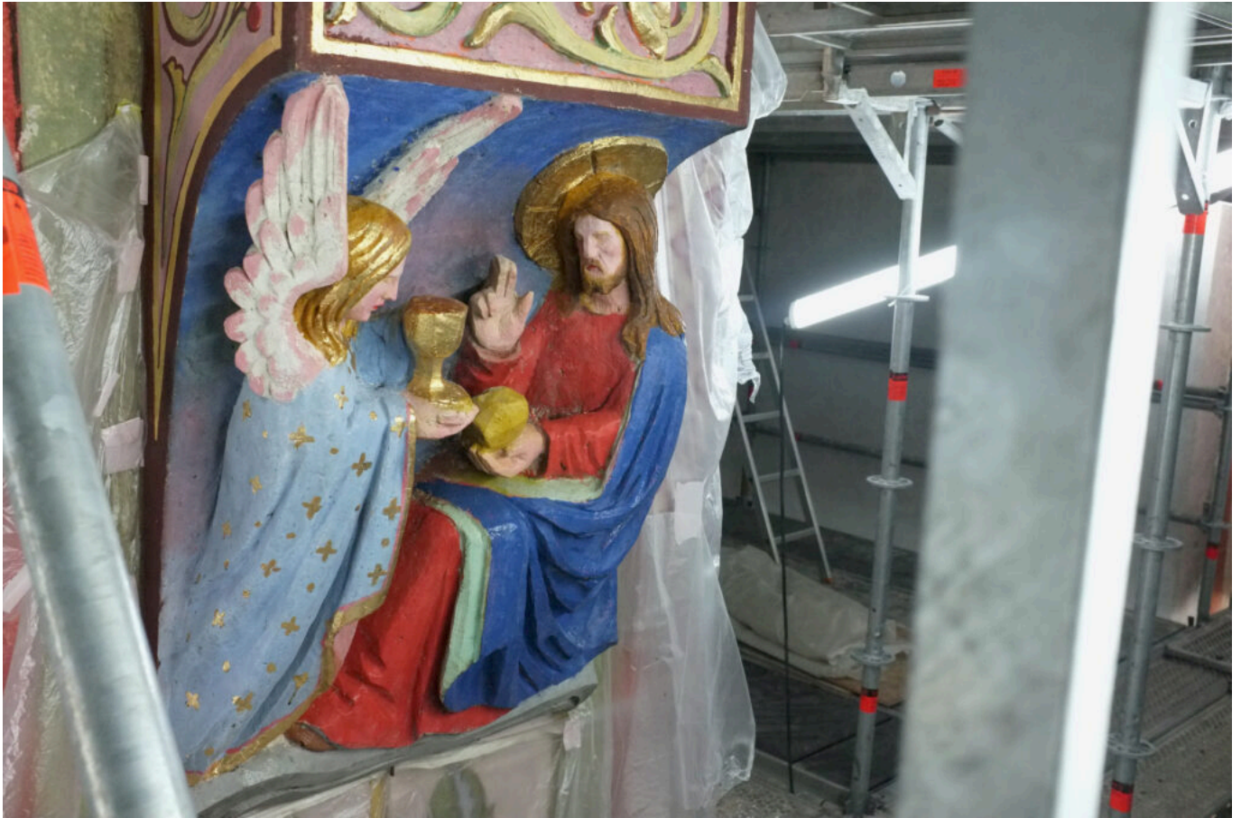
détail sculpture murale ©DB