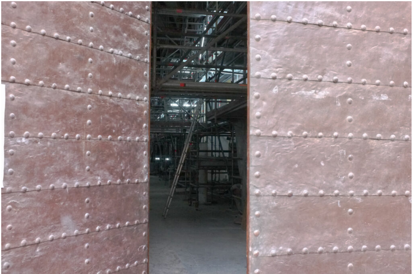
la porte d'entrée