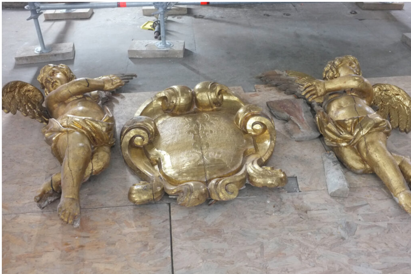
sculptures de bois dorée