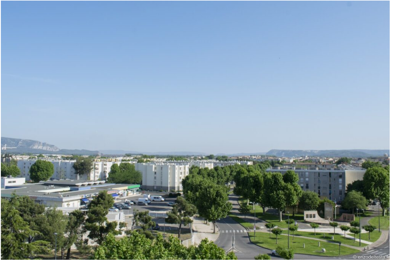
Vue du quartier du Docteur Ayme sans les 2 tours.