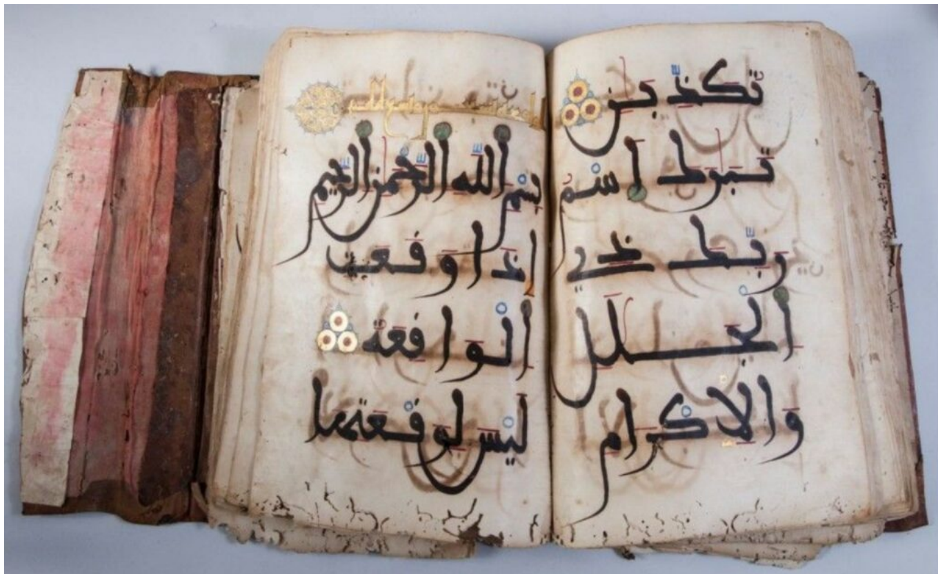
Manuscrit ancien