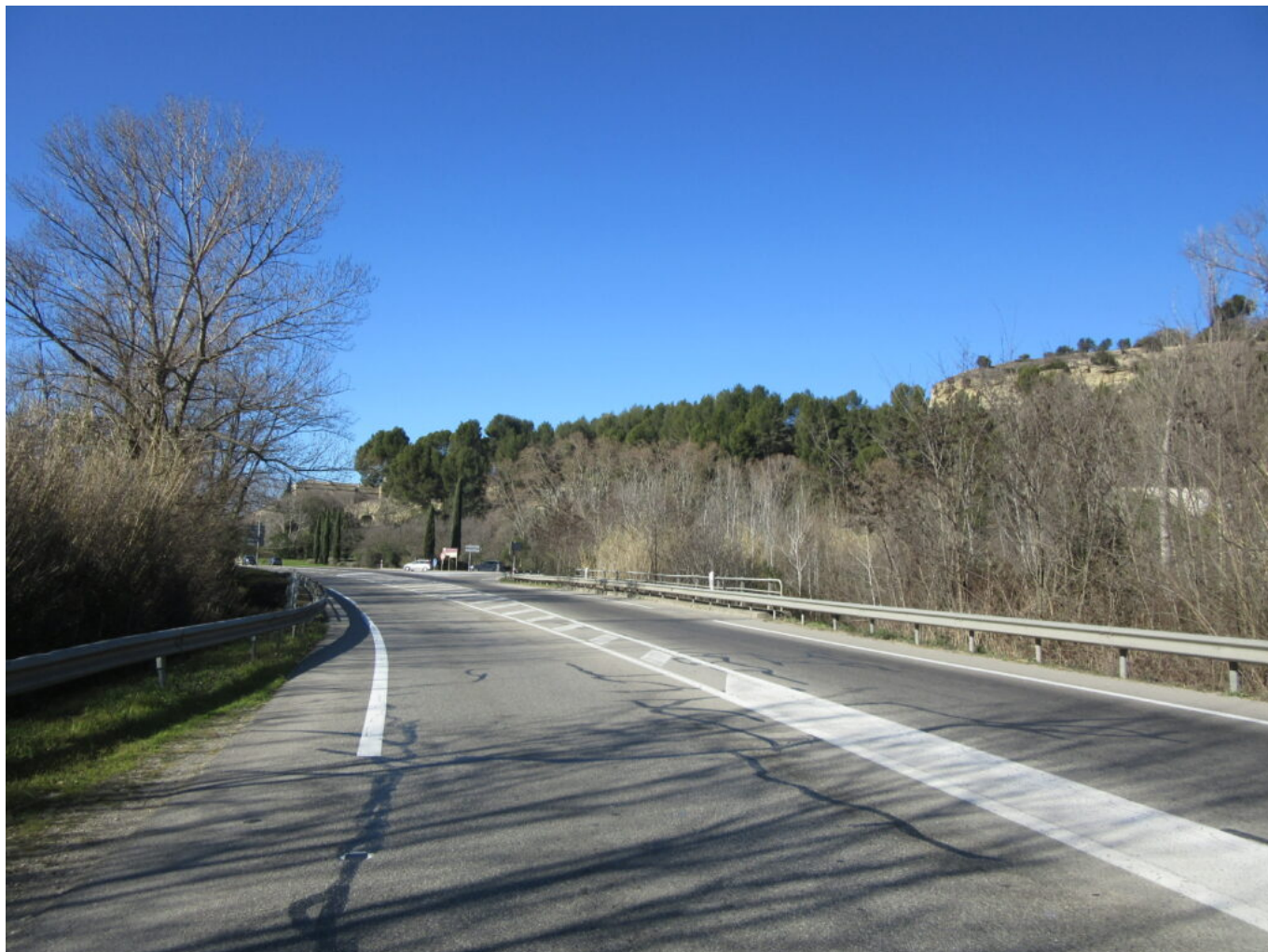
Itinéraire depuis Cavaillon