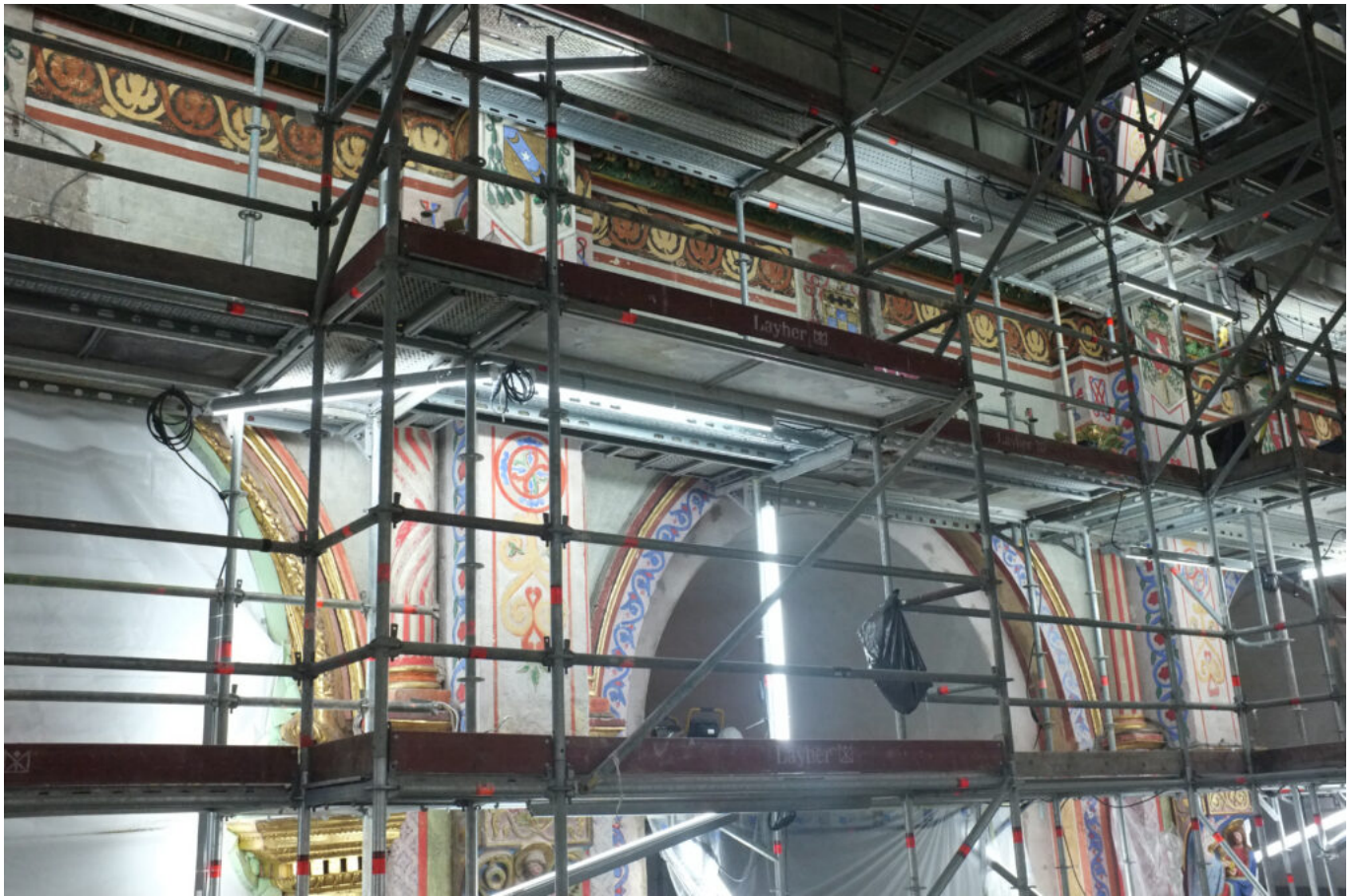
mur peint