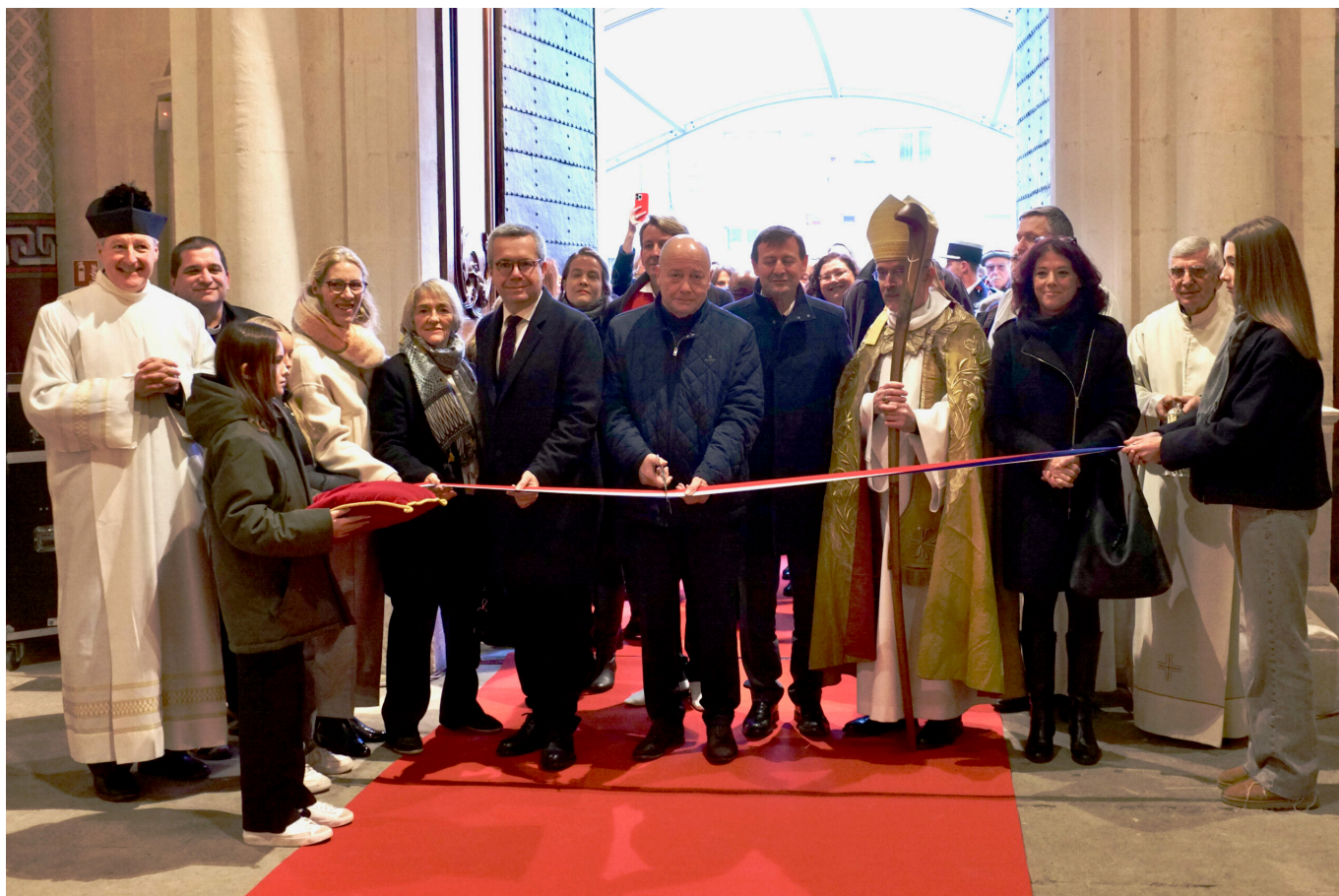
Les officiels coupent le ruban

cathédrale Notre-Dame et Saint-Véran de Cavaillon n'a pas été victime d'un incendie juste de cruels assauts du temps et aucun chef d'État n'était présent pour sa réouverture, mais cependant de nombreux officiels : maires, préfet, vice-présidentes de la région, du département, sénateur, députée... étaient présents.