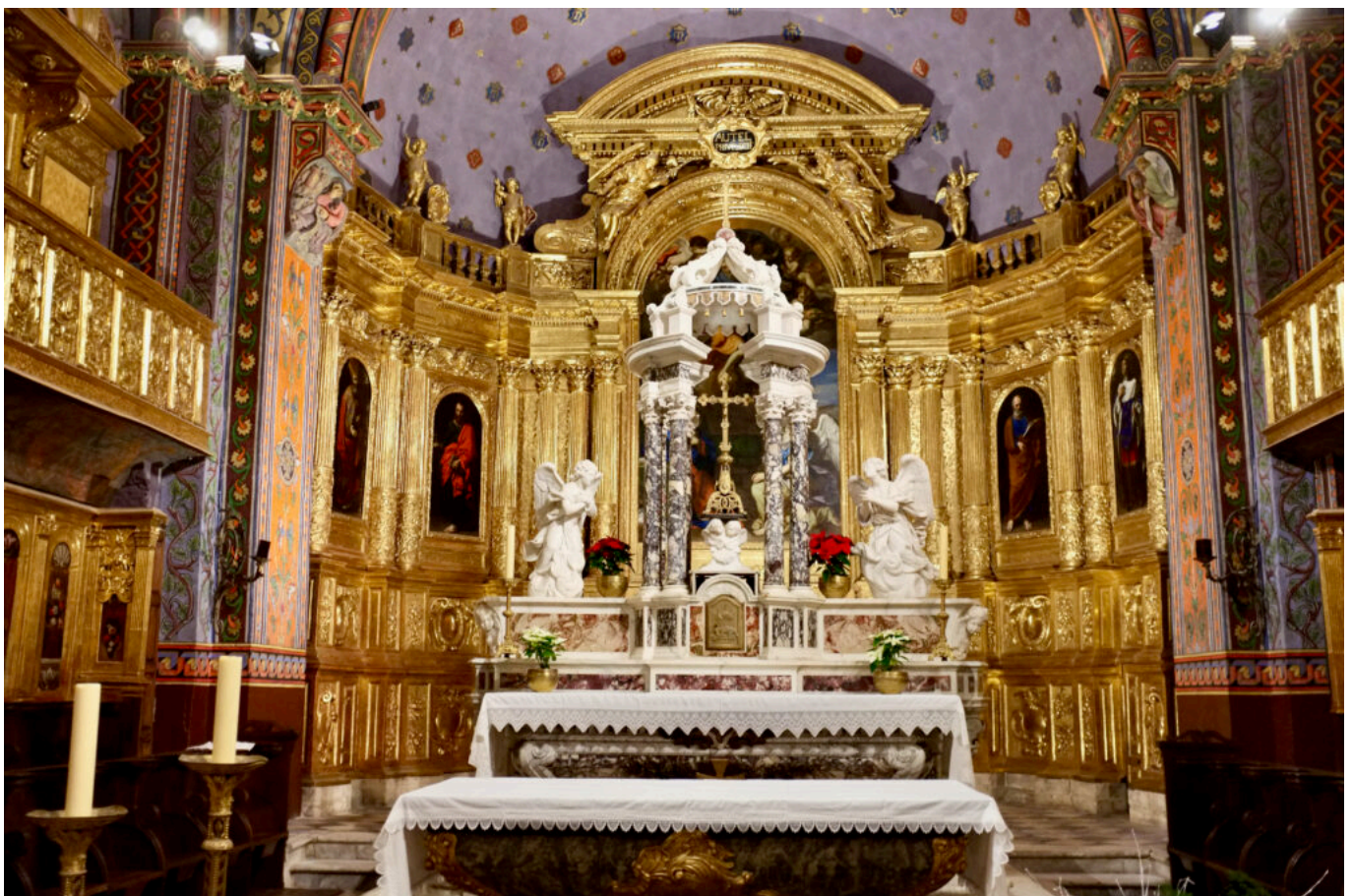
Le cœur de la cathédrale