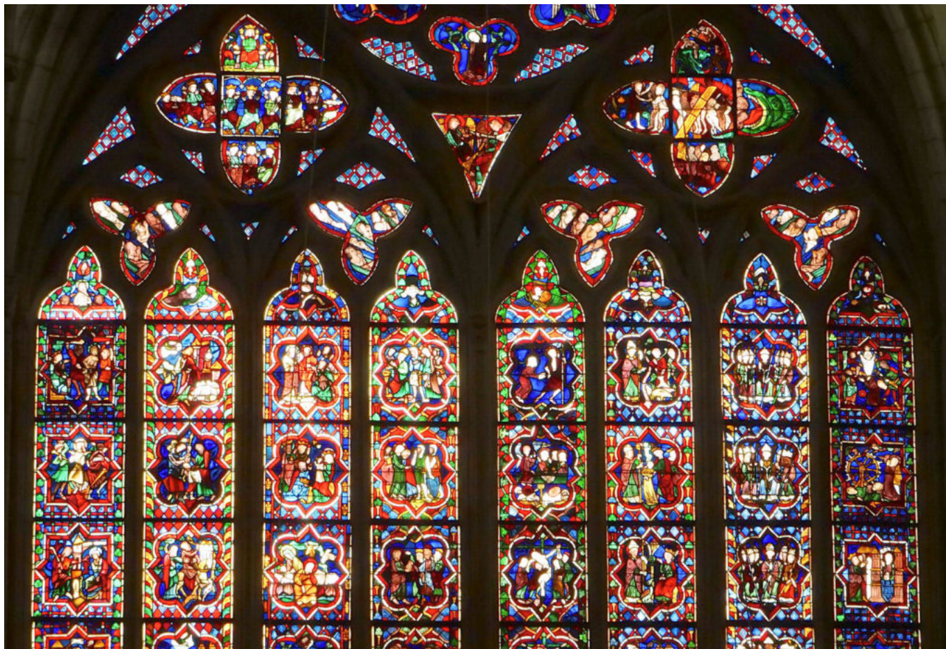
Cathédrale de Dol-de-Bretagne