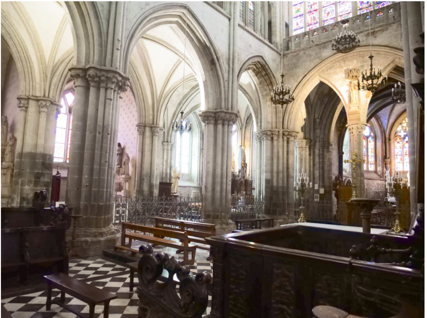
Cathédrale de Dol-de-Bretagne