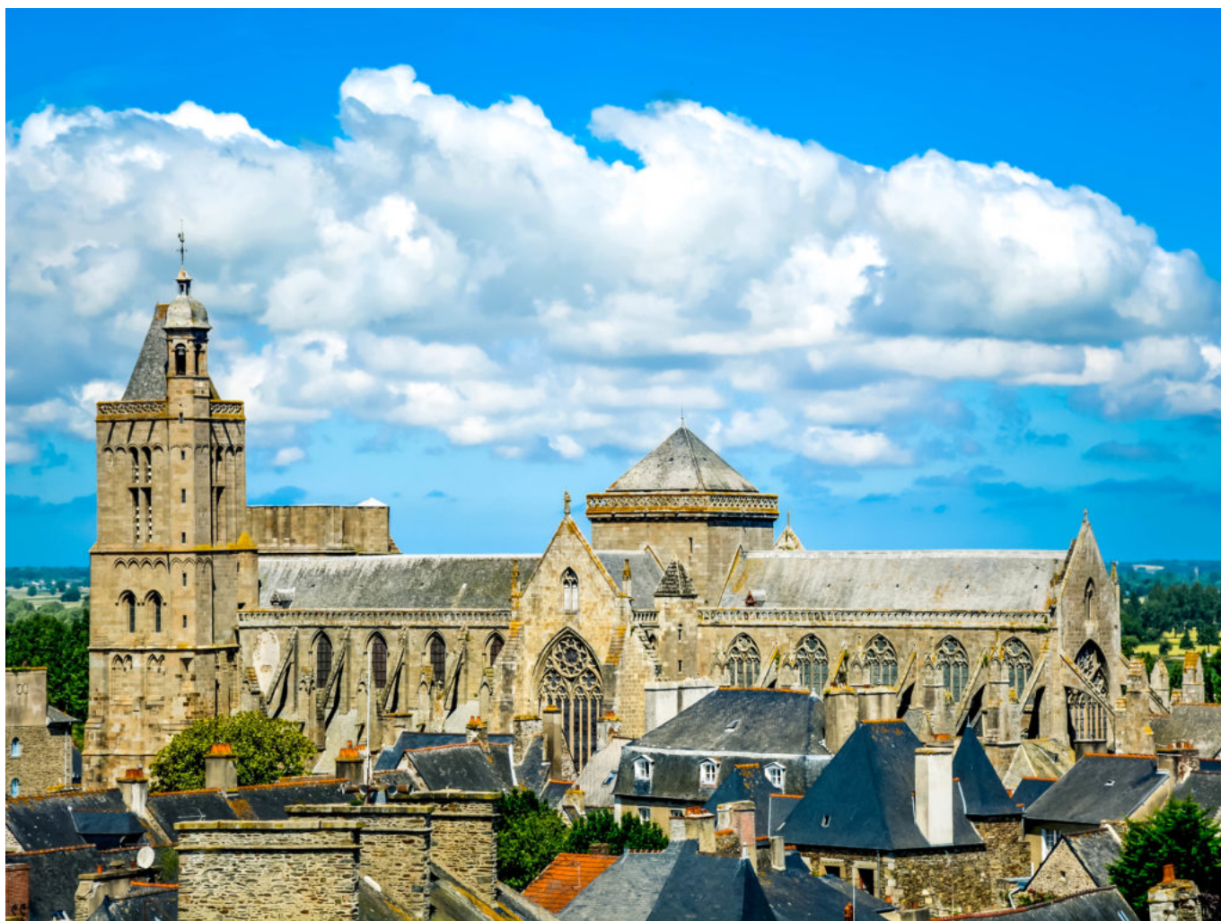
Cathédrale de Dol-de-Bretagne