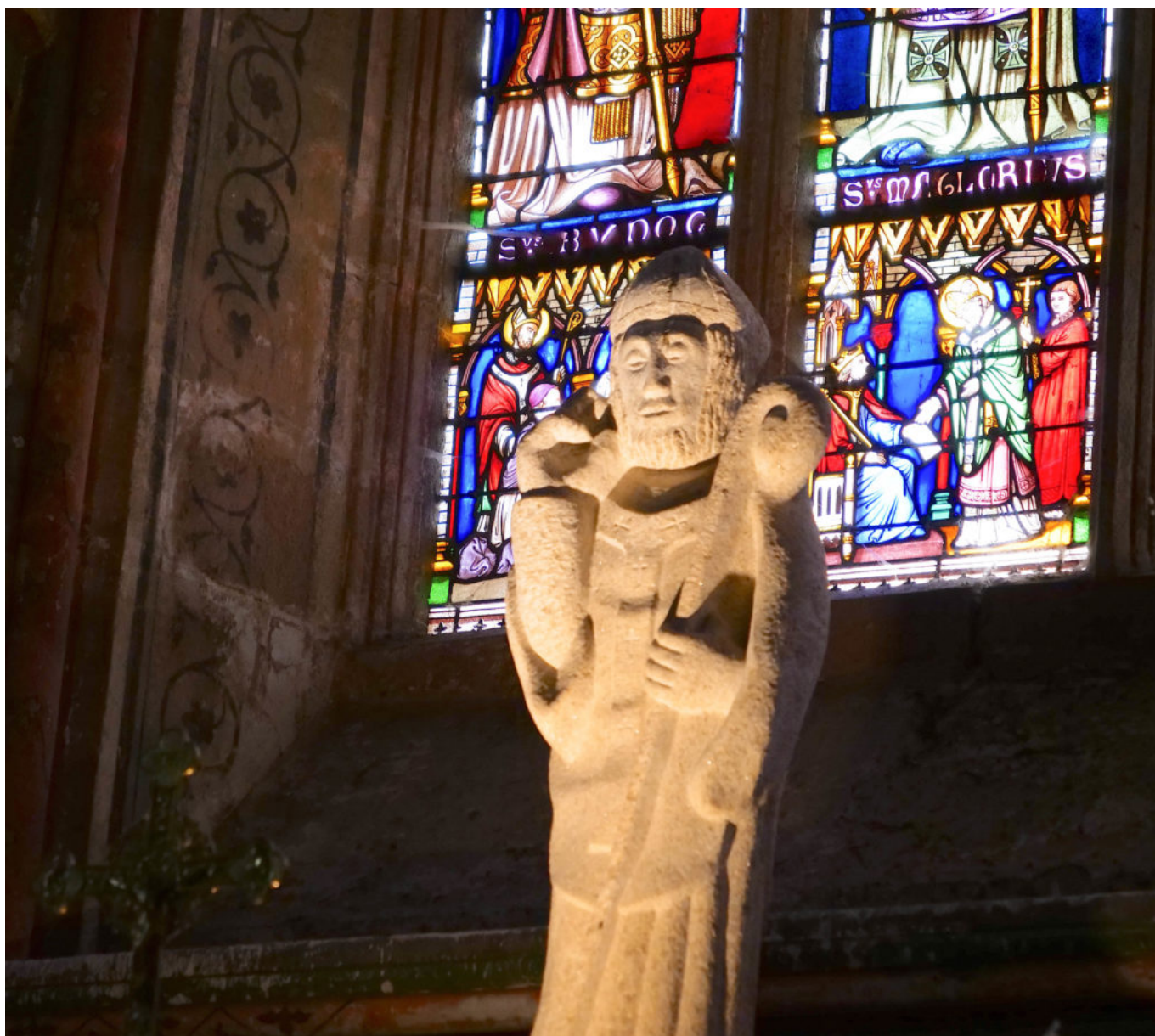
Cathédrale de Dol-de-Bretagne

L'édifice reste précieux à de nombreux titres : des stalles en chêne sculpté, un trône épiscopal, une grande verrière, le tombeau de Thomas James, une sculpture en bois du « Christ aux outrages », une chapelle absidale et la Sacristie dédiée à Saint Samson de Dol datant de la première moitié du 14 e siècle. Le chœur entouré d'un déambulatoire rectangulaire sur lequel donnent dix chapelles latérales dénote l'influence anglaise. La cathédrale de Dol compte parmi les rares édifices religieux bretons possédant encore des vitraux du 12 e siècle.