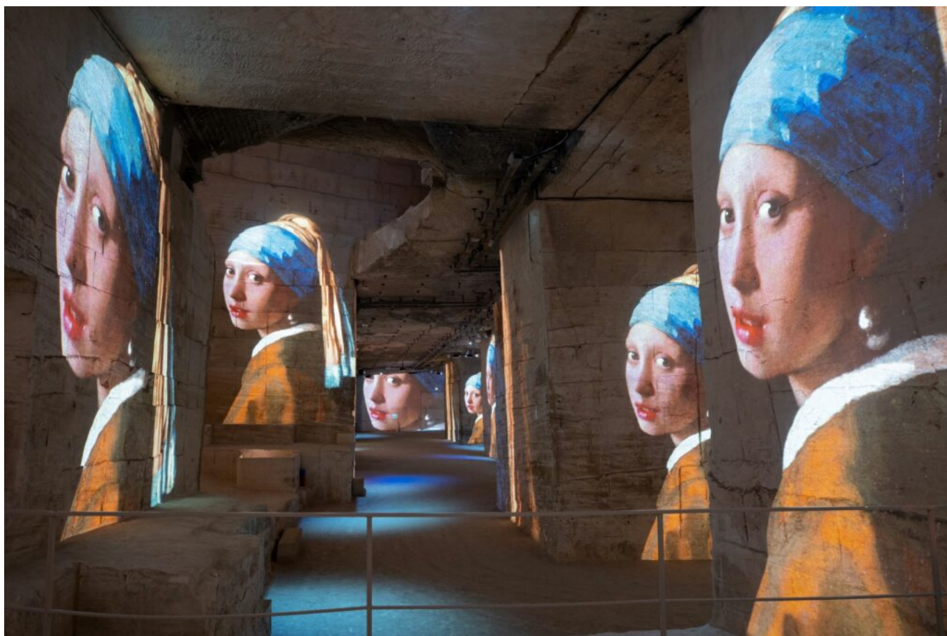
La jeune-fille à la perle