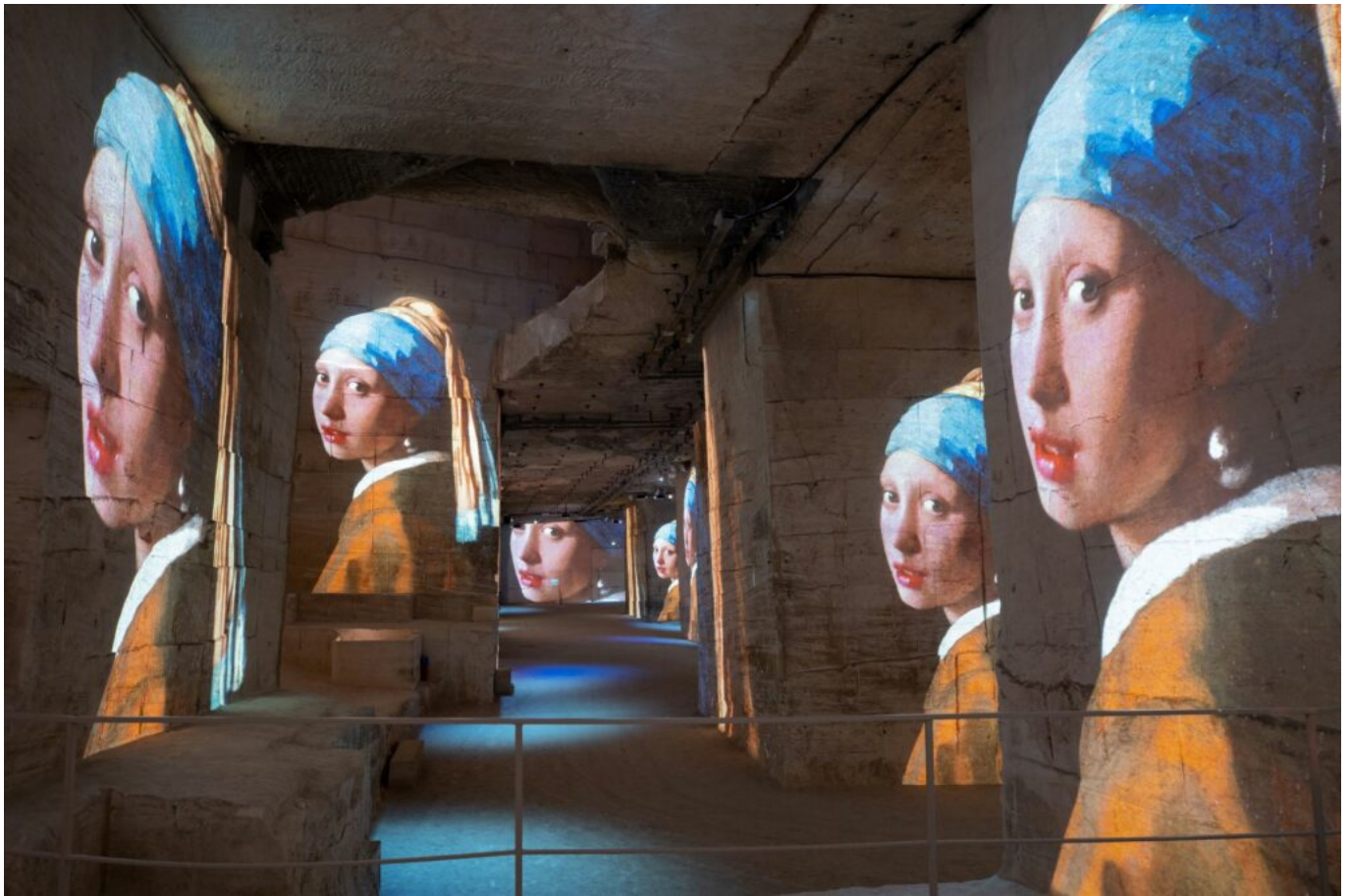
La jeune-fille à la perle