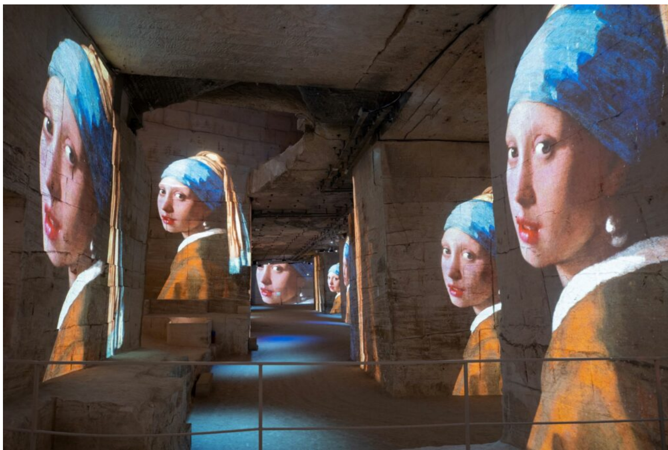
La jeune-fille à la perle