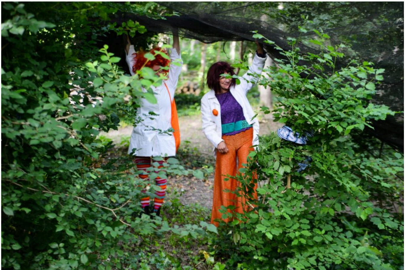
Les Fêlées du Tronc