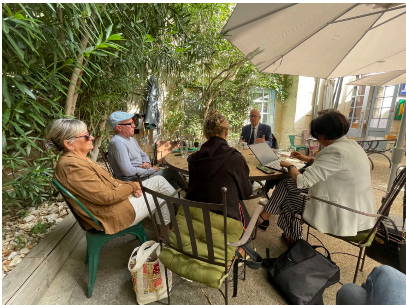
Dans les coulisses de la conférence de presse