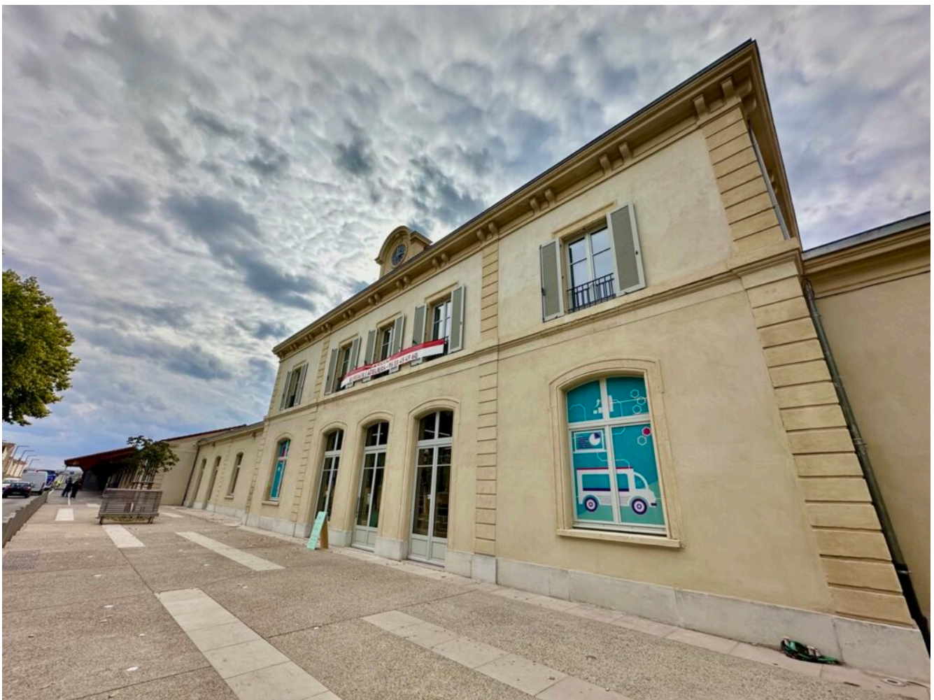
La Gare numérique, vue du côté de l'Avenue de la gare.