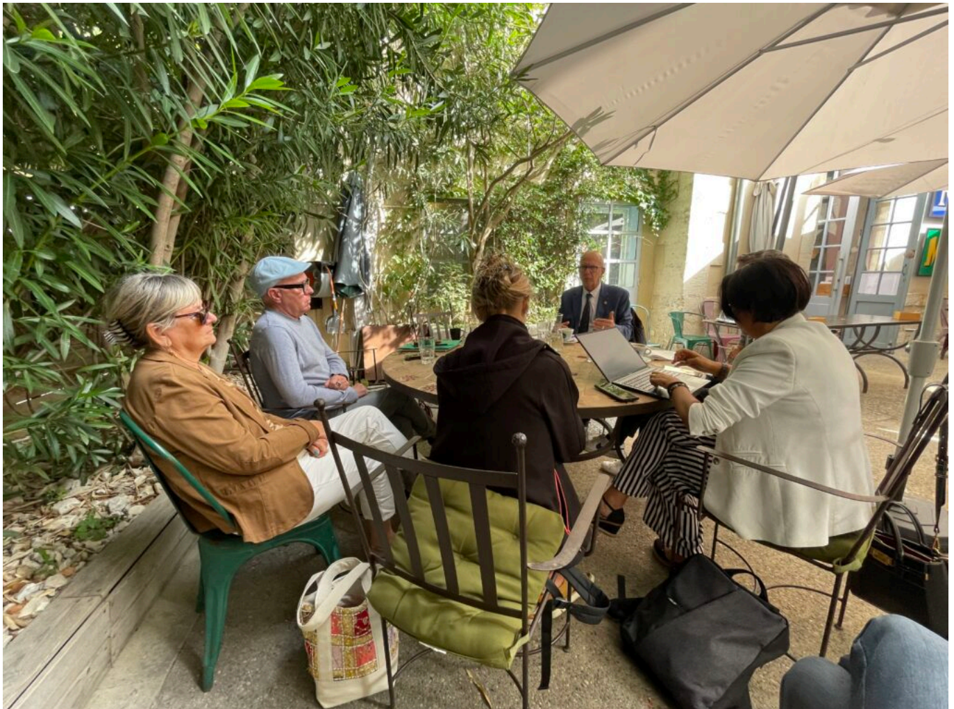
Dans les coulisses de la conférence de presse