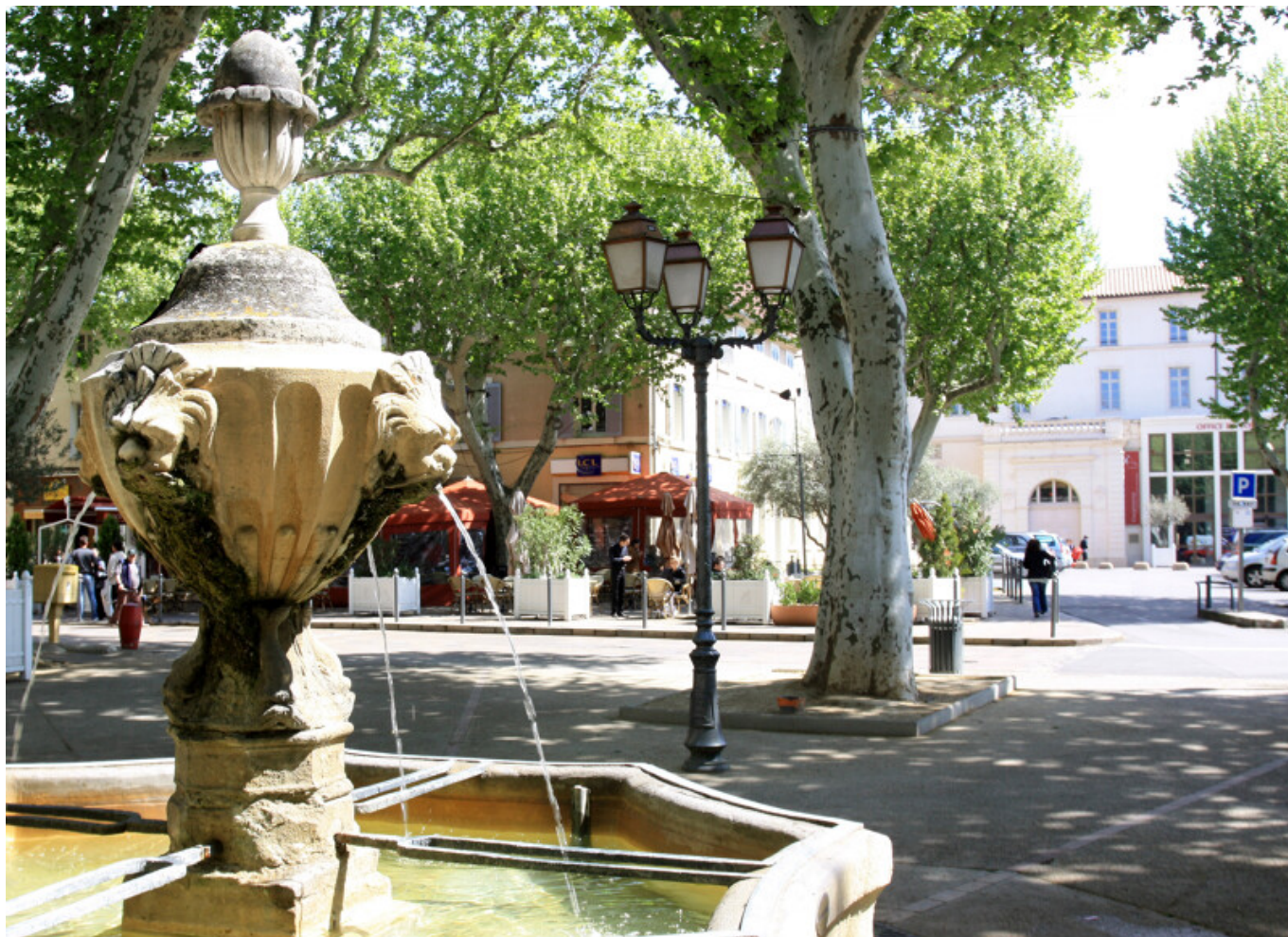
HOCQUEL A - VPA

Cet été, la ville de Carpentras a enregistré une hausse de fréquentation de 17% de son centre-ville. Dans le détail, cette augmentation s'élève à 15% durant le mois de juin, 20% en juillet, 26% en août et 17% en septembre par rapport à l'été 2022. Ce sont très précisément 780 100 piétons en juin, 769 500 piétons en juillet, 722 700 piétons en août et 779 400 piétons en septembre qui sont venus dans le centre de Carpentras