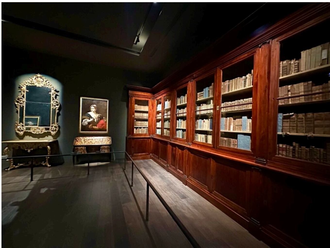
La bibliothèque de Barjavel