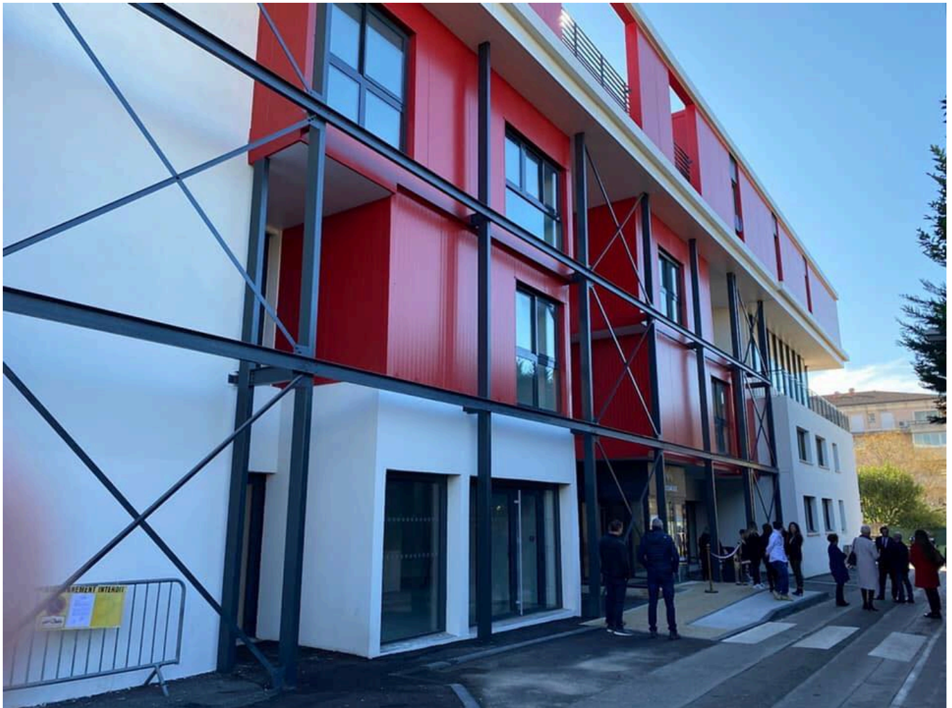
“Le Mosaïque”