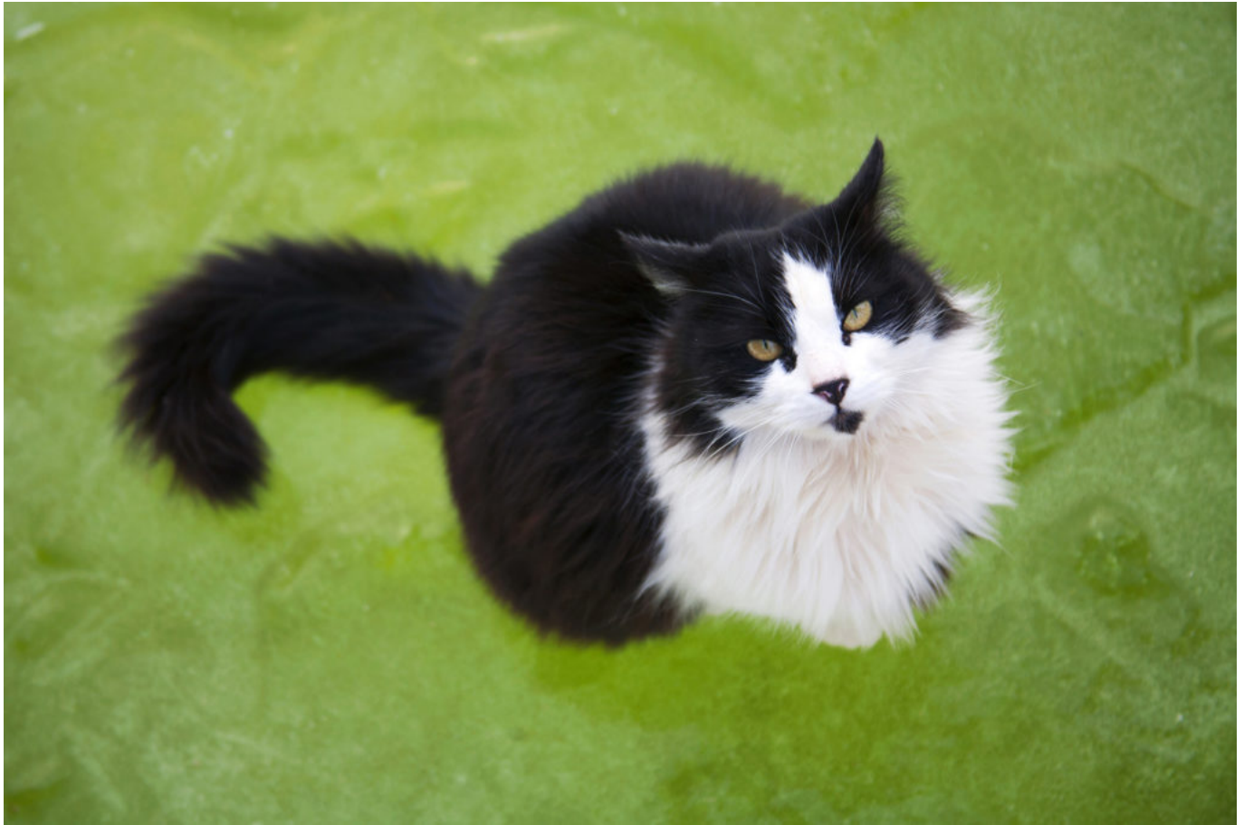
chat assis sur de l'eau gelée / cat sitting on frozen water