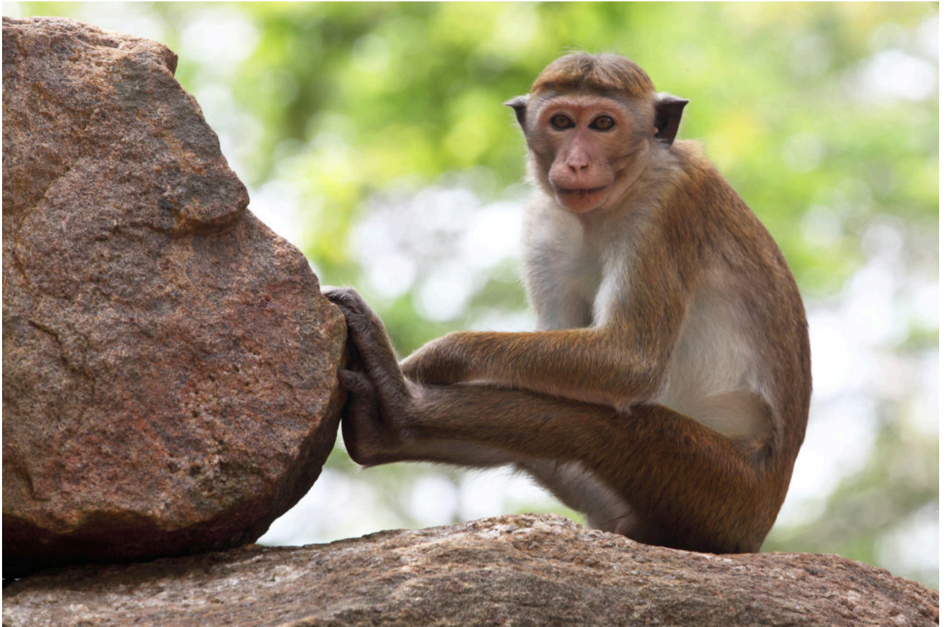
Portrait d'un singe assis