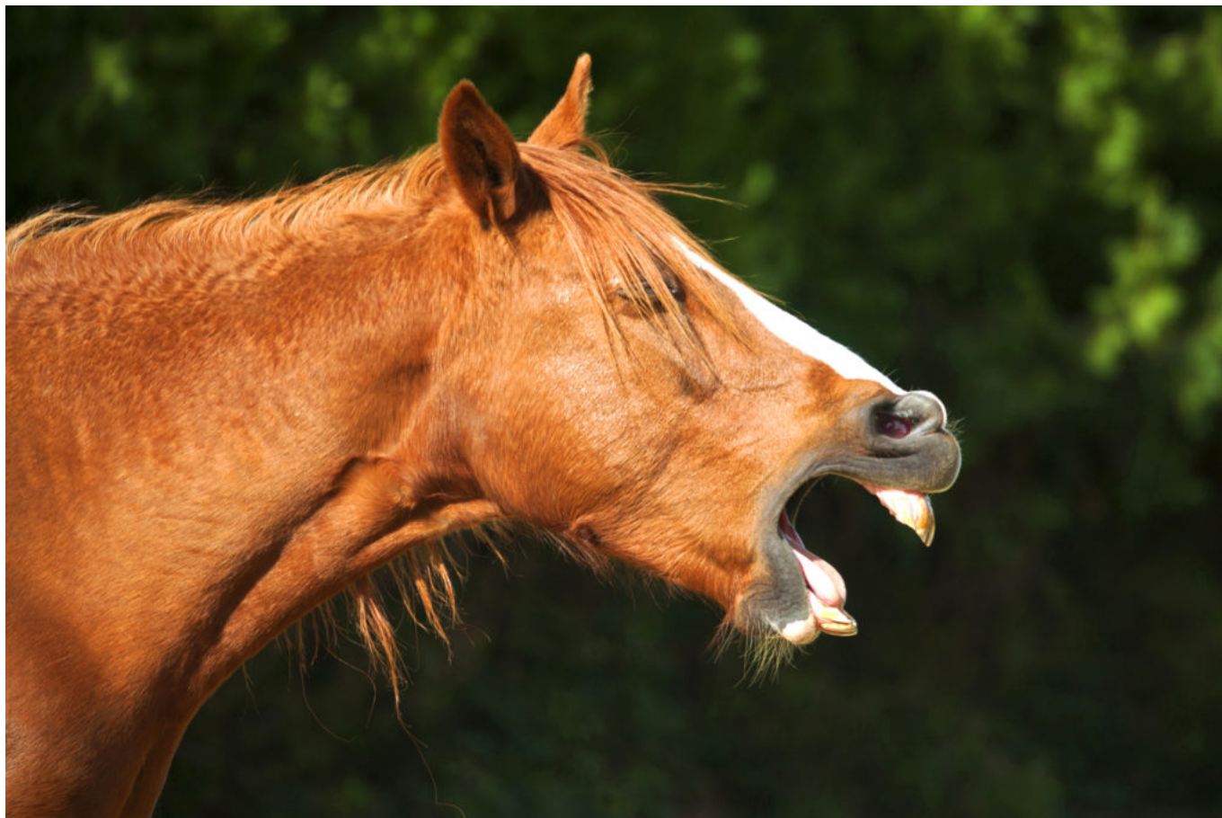
portrait d'un cheval hénissant / portrait of a horse henifying / Photos © Eric Guilloret

J'étais très attiré par le milieu artistique, les artistes me faisaient rêver, même si à l'époque je ne vendais pas mes clichés. Oui, maintenant j'ai de sacrés photos d'archives !»