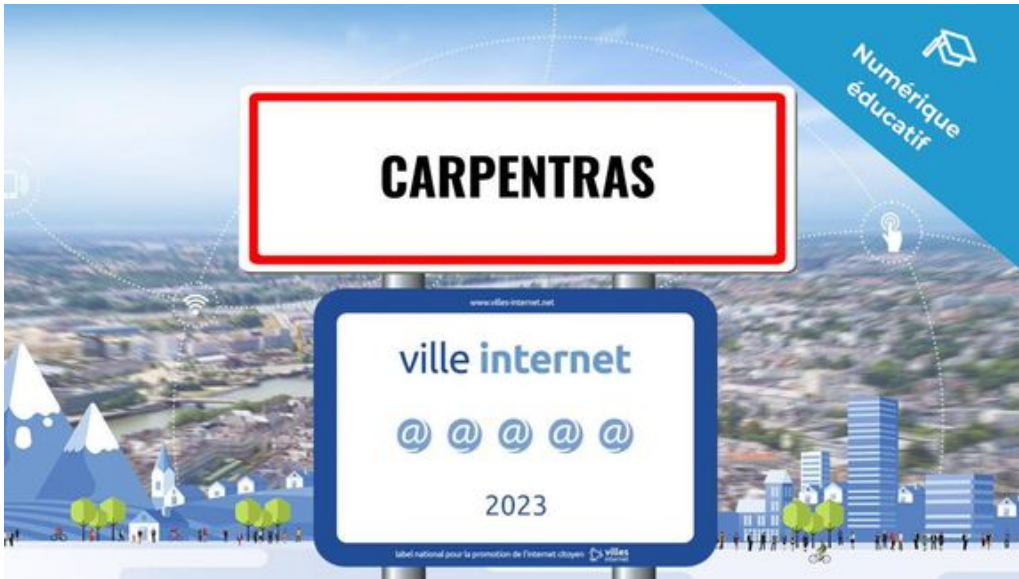
Figure de proue de cette excellence numérique départementale, avec ses 5 @@@@ Carpentras décroche le niveau le plus élevé de ce label récompensant chaque année les collectivités qui œuvrent significativement pour la démocratisation des technologies de l'information et de la communication et de leurs usages citoyens.

Longtemps classée avec 4 @@@@ la cité comtadine s'est notamment distingué dans le cadre du 'Numérique éducatif' qui lui a permis d'obtenir une mention spéciale du jury dans ce domaine. Carpentras étant l'une des trois villes hexagonales à se voir octroyer cette distinction.