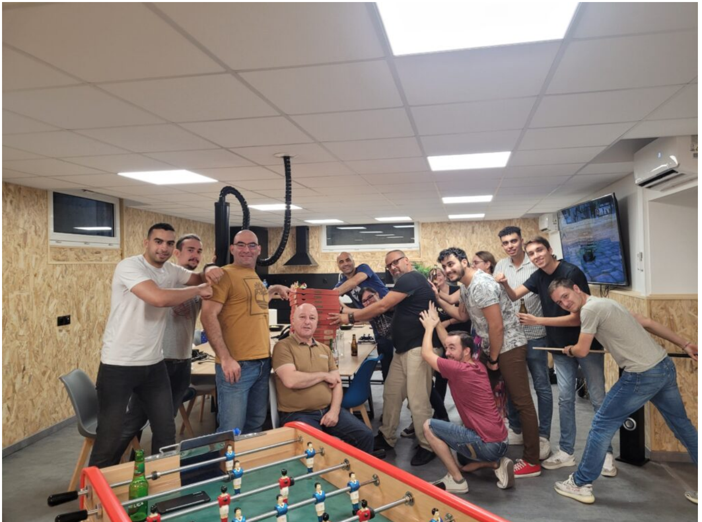
Soirée pizza et jeux