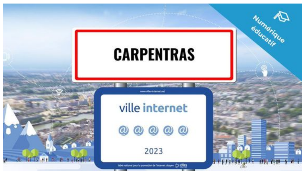
Figure de proue de cette excellence numérique départementale, avec ses 5 @@@@ Carpentras décroche le niveau le plus élevé de ce label récompensant chaque année les collectivités qui œuvrent significativement pour la démocratisation des technologies de l'information et de la communication et de leurs usages citoyens.

Carpentras, Courthézon et Montoux figurent parmi les 257 collectivités françaises à apparaître dans le palmarès 2023 des ' Territoires, villes et villages internet ' qui vient d'être dévoilé lors d'une cérémonie de remise de prix qui s'est tenue à Albi. Placée sous le haut patronage du président de la République, cette distinction est remise depuis 1998 par l'association ' Villes internet ' qui s'est donnée pour mission d'accompagner le déploiement des politiques publiques numériques locales.