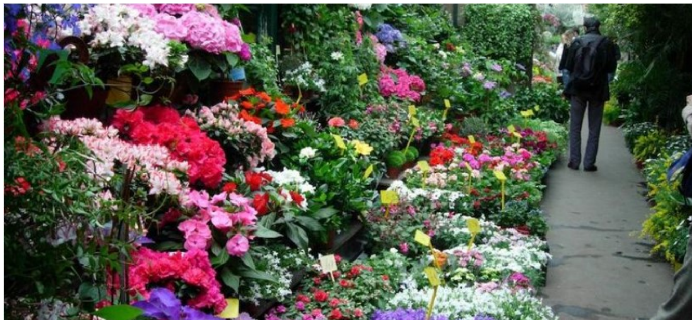
Le marché aux fleurs

des antiquités et une brocante organisées par la société Ego .