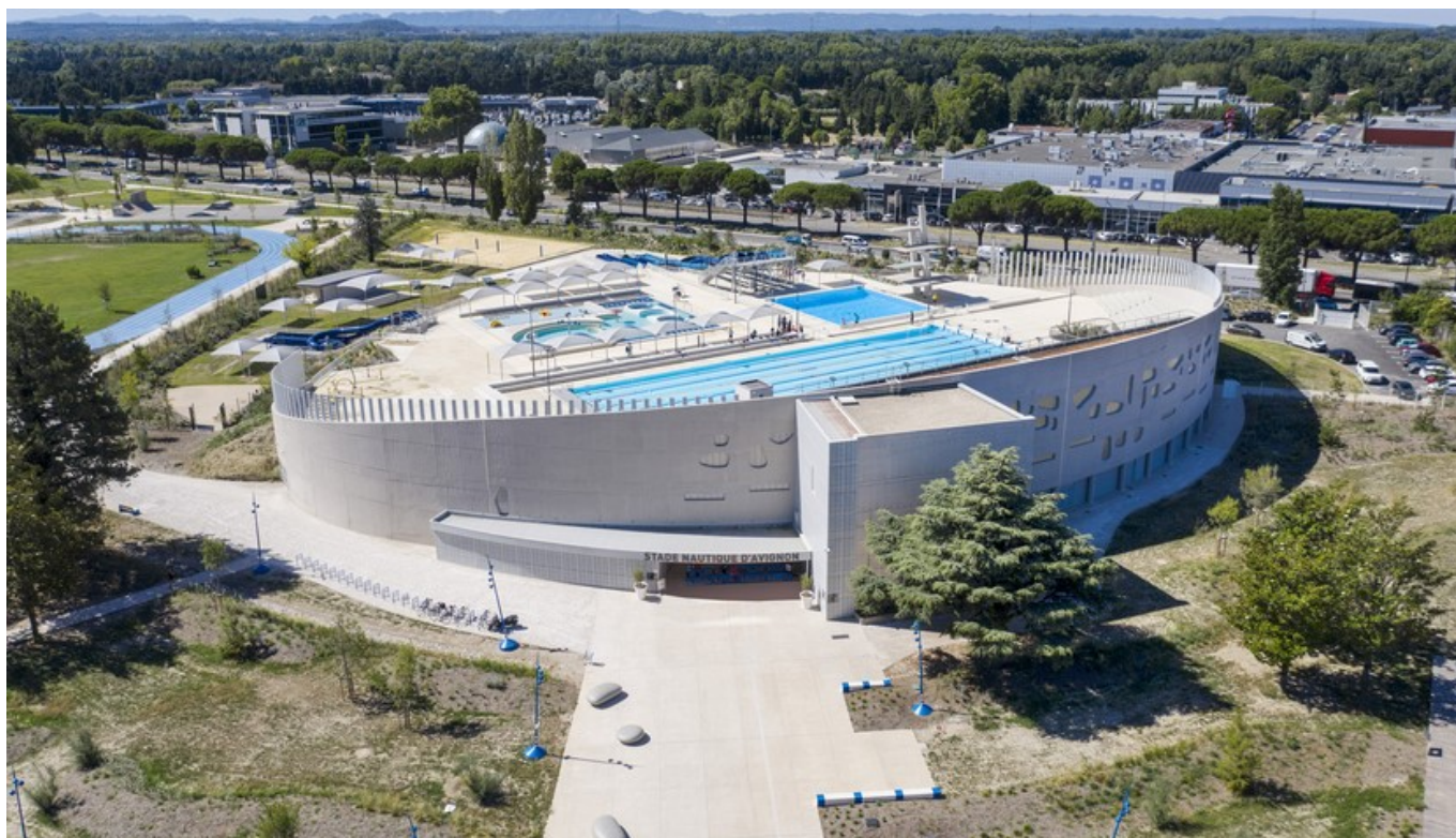
DR Le stade nautique à Avignon

http://www.avignon.fr/espaces-culturels-et-sportifs/les-piscines-municipales/