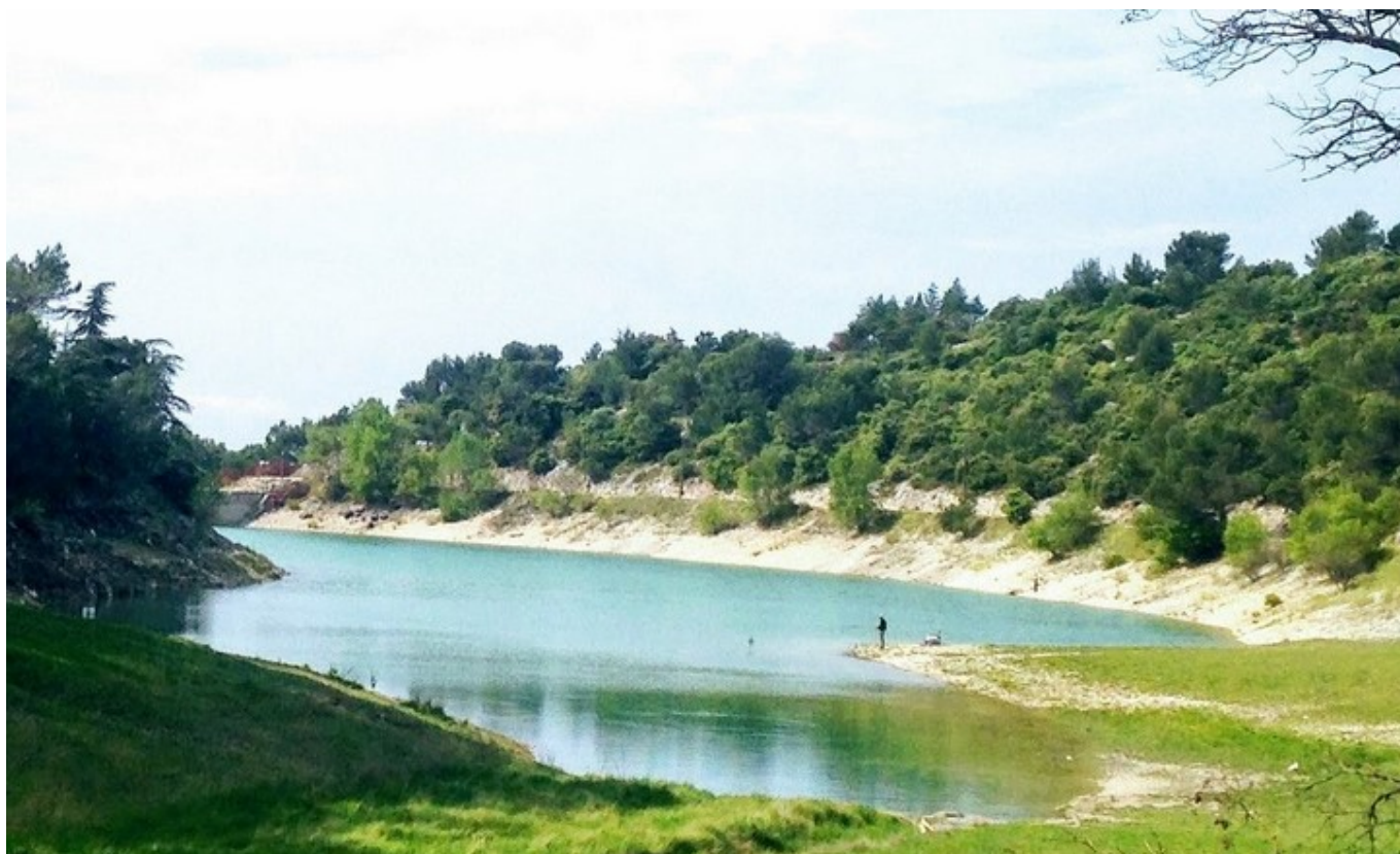
DR Le Lac du Paty à Caromb