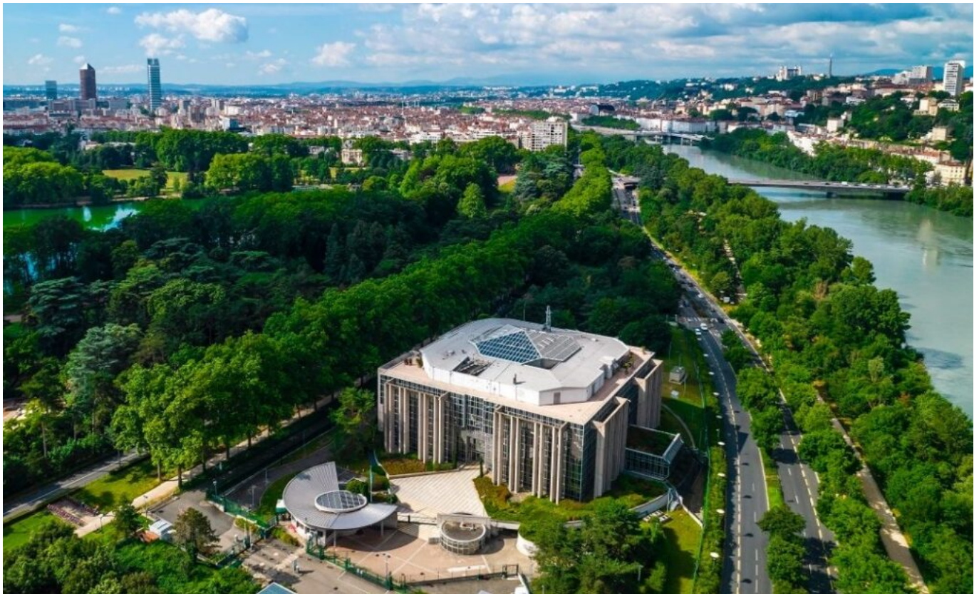
Le siège d'Interpol à Lyon.

Interpol, cette police internationale d'élite, dispose d'une base de données tous azimuts de 12 millions de photos, vidéo, empreintes digitales et numériques, échantillons d'ADN et ses agents d'un réseau mondial d'informations cryptées qui leur permet d'échanger en toute sécurité 24h/24 pour la protection et la sécurité de tous.