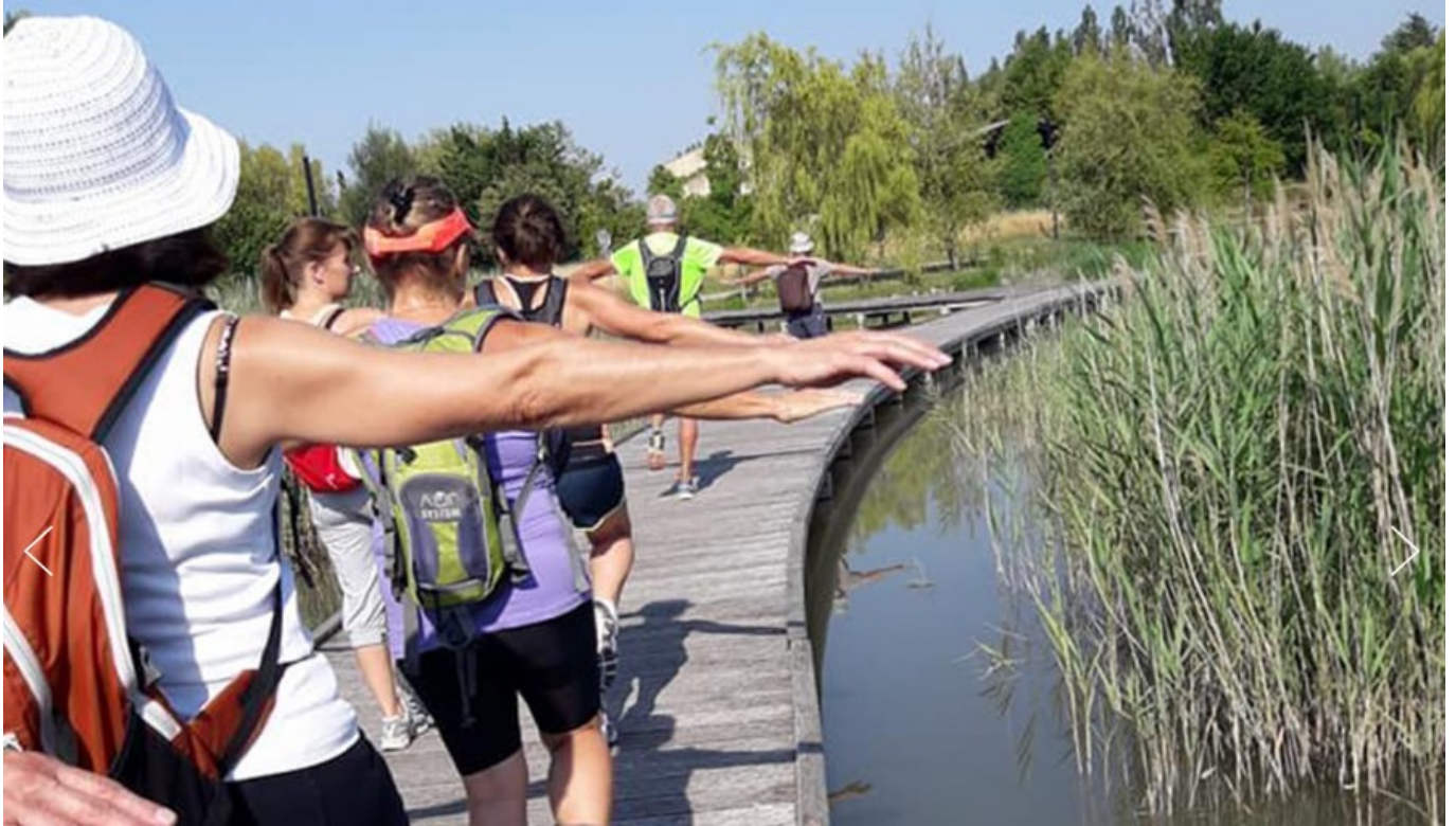
Sport avec l'Asl du lac de Monteux, Copyright ASL Lac de Monteux