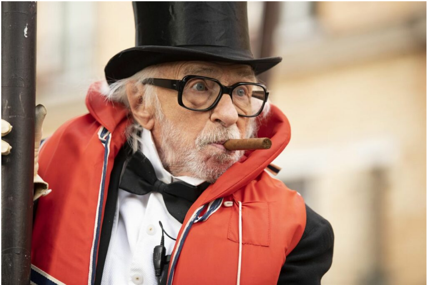
Pierre Richard, Les vieux fourneaux