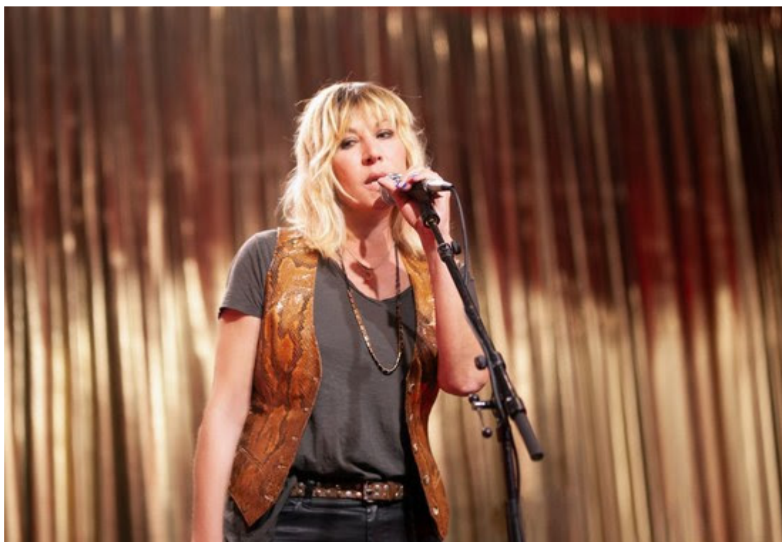
Mathilde Seigner interprète Alex dans « Chœur de rockers »

L'avant-première aura lieu lundi 17 octobre à 20h. Le film sortira officiellement dans tous les cinémas le 28 décembre prochain. Pour assister à cet évènement, il faut réserver sa place à la caisse ou ici .