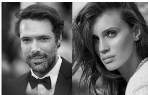
Nicolas Bedos (réalisateur) et Marine Vacth (actrice)

L'avant-première aura lieu le samedi 29 octobre à 20h, quelques jours avant la sortie officielle prévue le 1er novembre. Pour assister à cet évènement, il faut réserver sa place à la caisse ou sur internet .