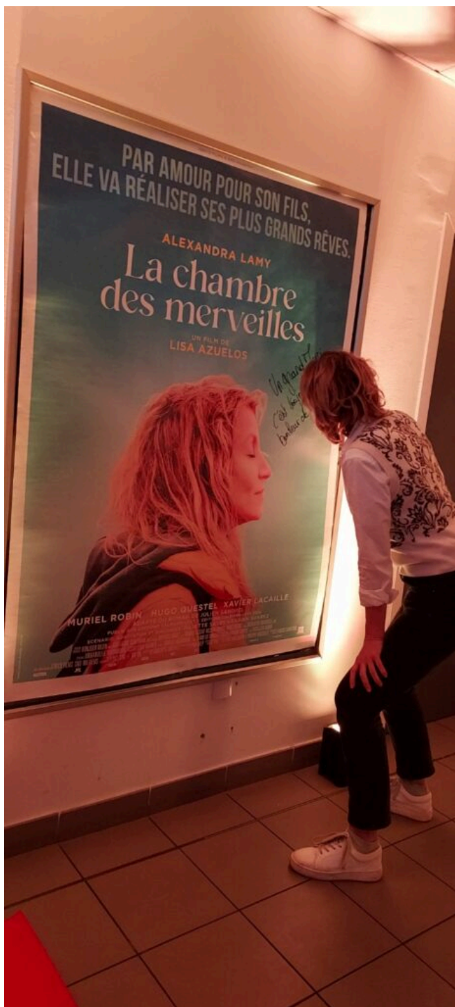
Alexandra Lamy dédicace l'affiche du film au Capitole.