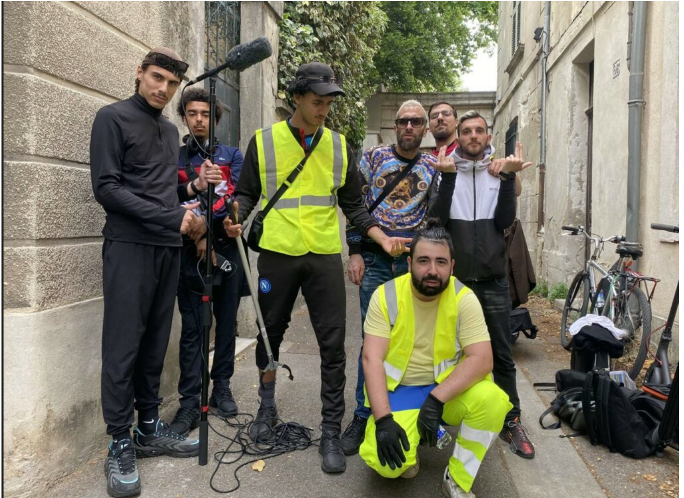
Une partie de l'équipe du film.