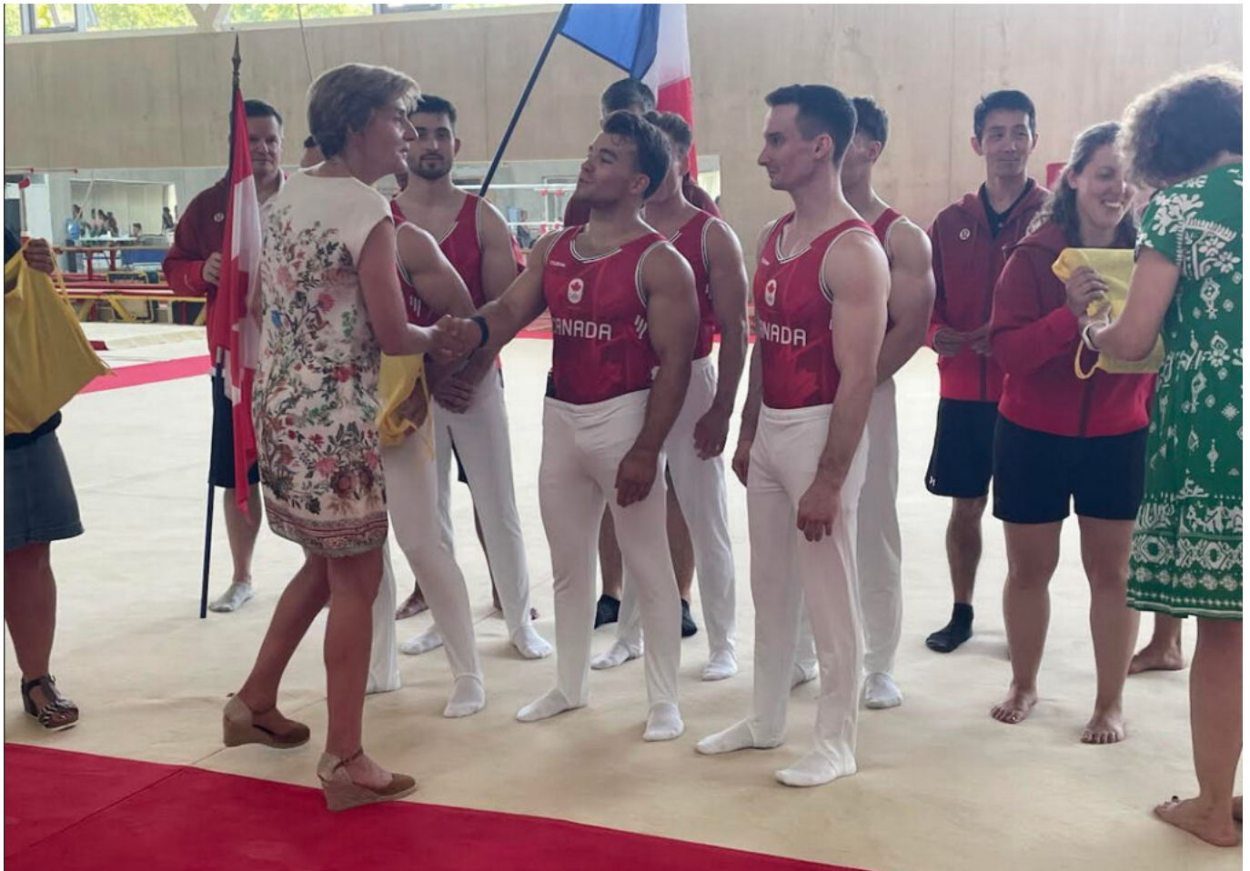
La maire d'Avignon, Cécile Helle qui remet un cadeau de bienvenue aux athlètes canadiens