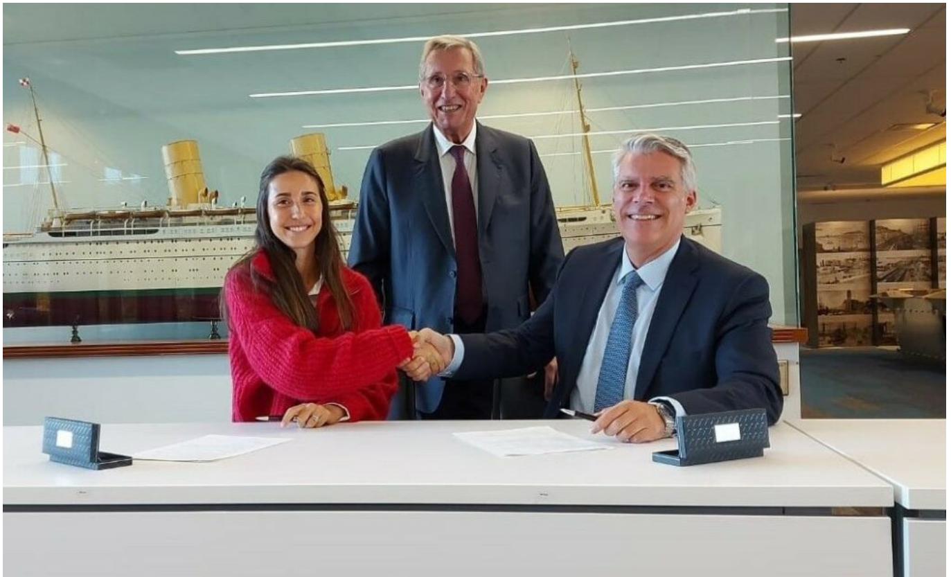
Signature entre Novarium et risingSUD

Pour créer de nouvelles synergies avec le Québec, risingSUD a mené deux missions cet automne. La première du 17 au 21 octobre à Montréal, avec Vaucluse Provence Attractivité et Euroméditerranée , pour identifier des projets d'investissement sur la filière Naturalité (cosmétiques et parfums, agroalimentaire), l'investissement immobilier et les jeux vidéo à l'occasion du salon Megamigs .