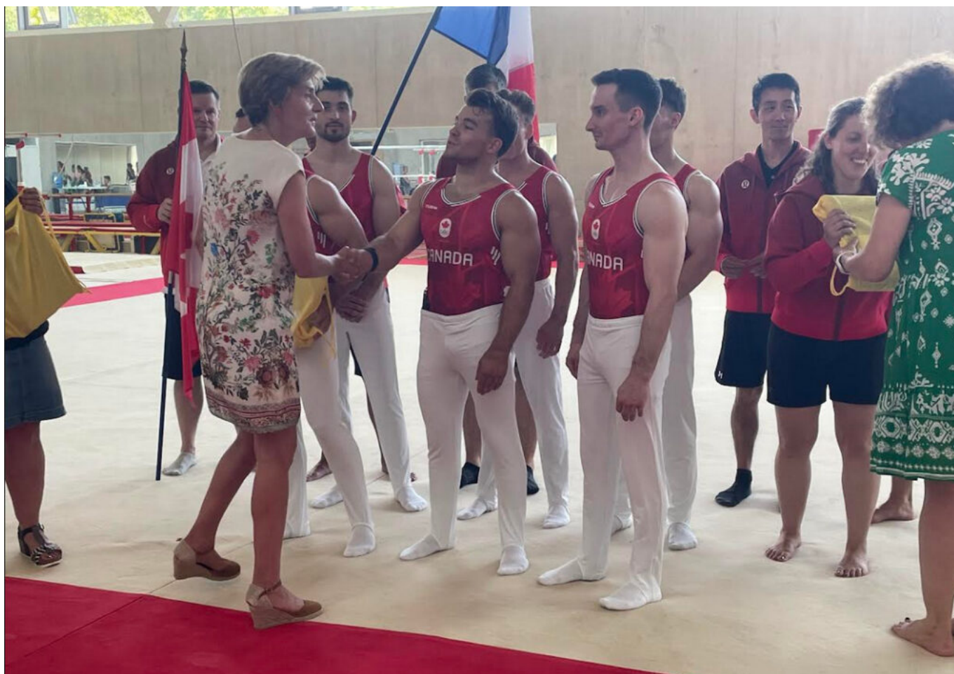
La maire d'Avignon, Cécile Helle qui remet un cadeau de bienvenue aux athlètes canadiens