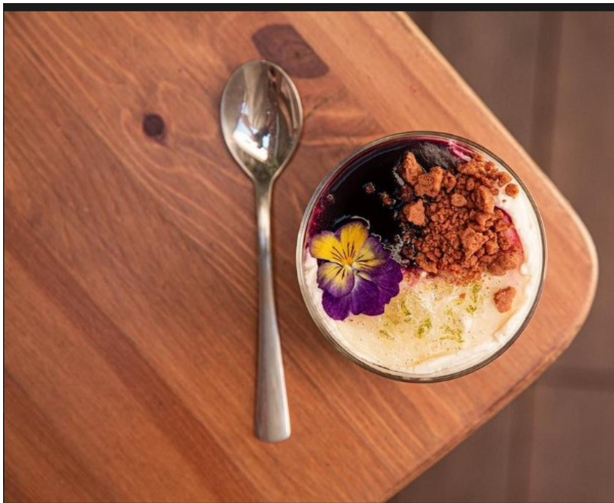
Plat concocté par la cheffe Irène Khaletzky

Pour les jardiniers en herbe, Emma Castanier proposera des ateliers de bouture de plantes pour apprendre à les multiplier. Les participants repartiront avec une plante et tous les conseils d'entretien afin d'en prendre soin chez eux. De nombreuses plantes d'intérieur produites localement ou de seconde main seront disponibles à l'adoption, en accès libre tout au long de la journée.