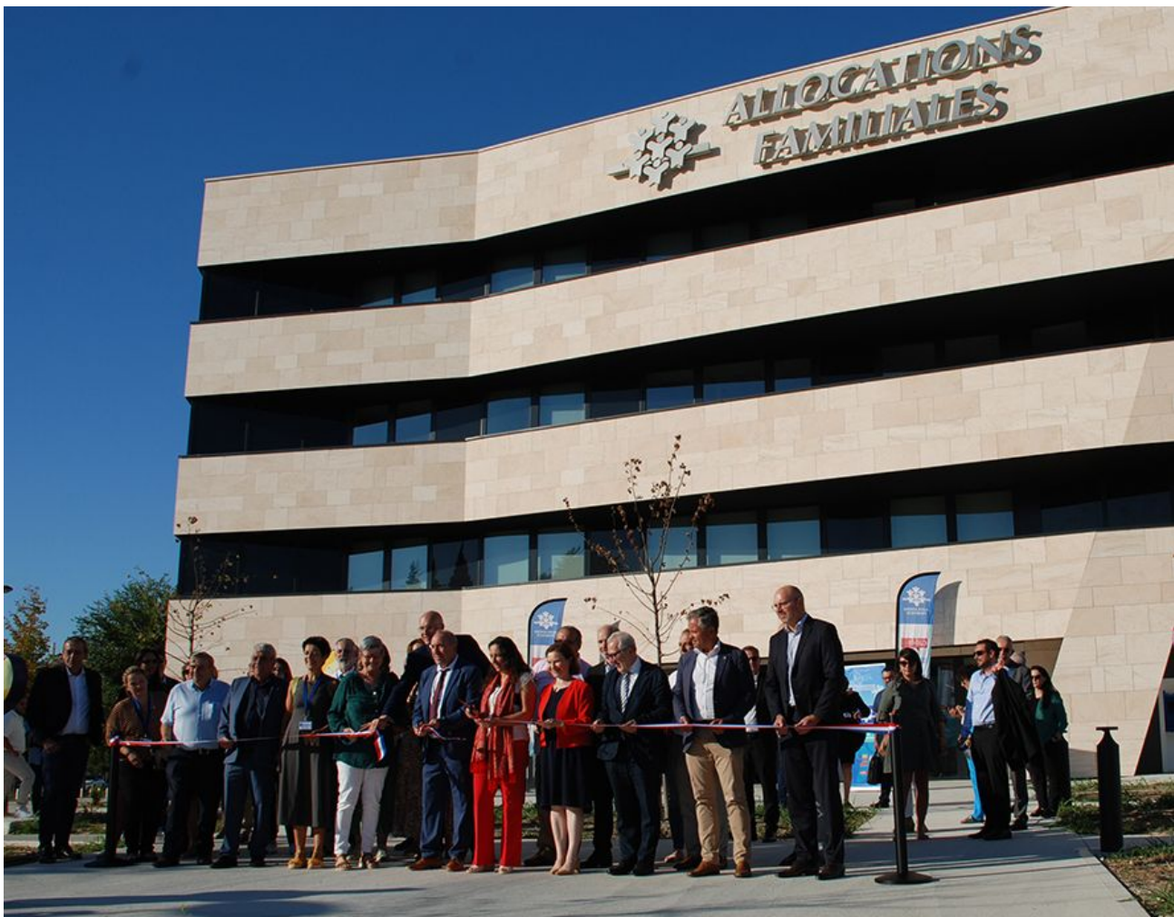
L'inauguration officielle du nouveau siège de la Caf de Vaucluse.

Même satisfaction pour Joël Guin, président du Grand Avignon, qui lançait il y a peu le 1 er macro-lot de Courtine qui verra le jour à quelques mètres seulement du nouveau siège vauclusien de la Caf.