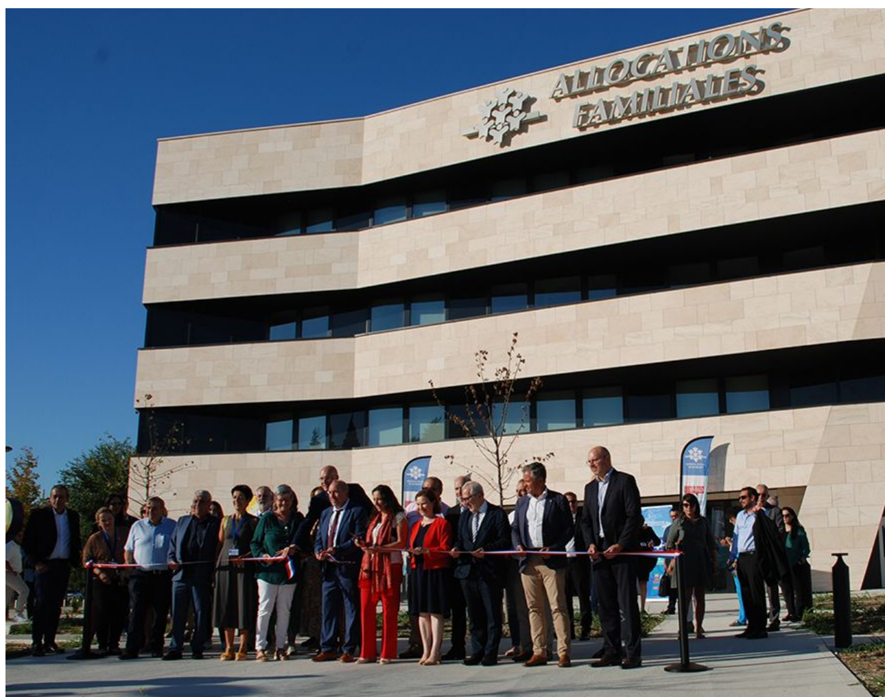
L'inauguration officielle du nouveau siège de la Caf de Vaucluse.

Même satisfaction pour Joël Guin, président du Grand Avignon, qui lançait il y a peu le 1 er macro-lot de Courtine qui verra le jour à quelques mètres seulement du nouveau siège vauclusien de la Caf.