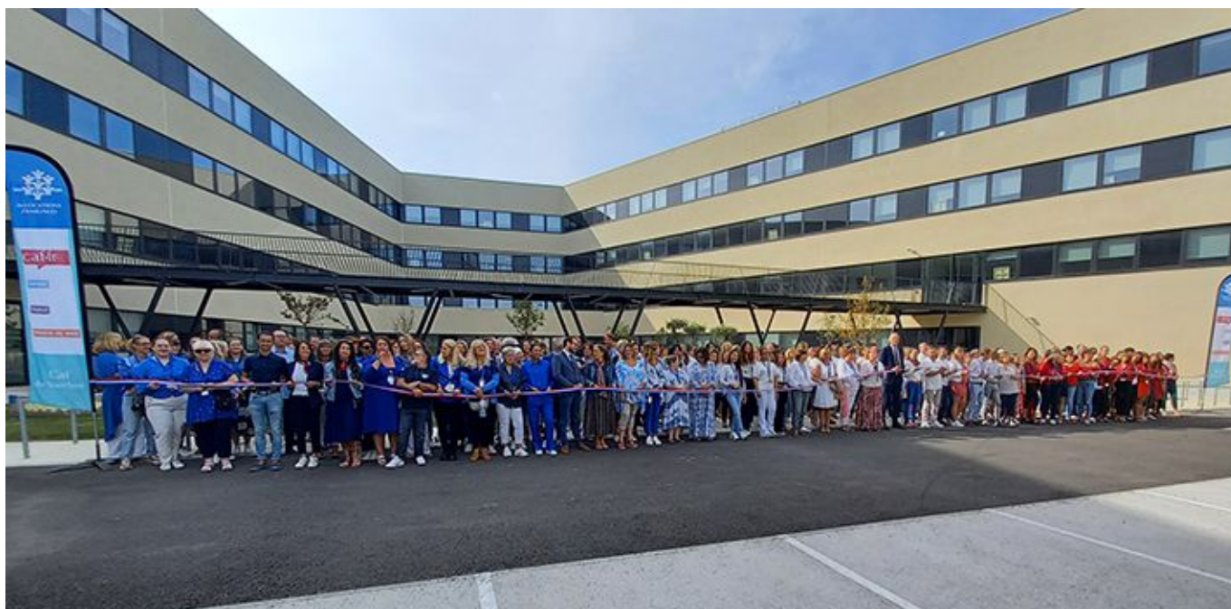
Les agents de la Caf 84 lors de l'inauguration.

Par ailleurs, afin de faciliter l'accès des usagers un parking gratuit et sécurisé est disponible au niveau du boulevard Pierre-Boule. Le site est aussi desservi par 3 lignes de bus, la 'virgule' ferroviaire de la gare TGV ainsi que plusieurs pistes cyclables.