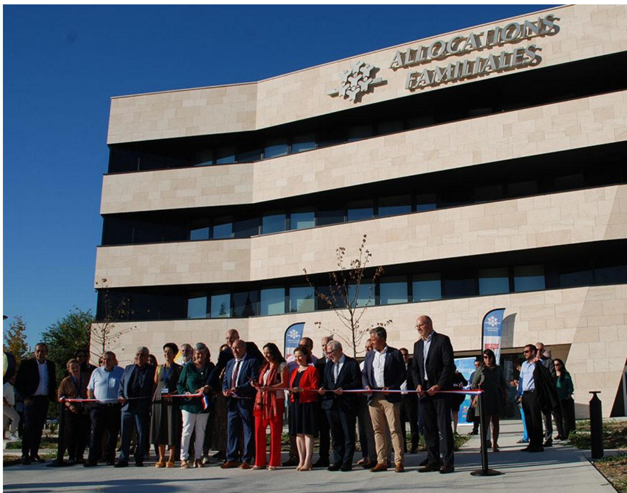
L'inauguration officielle du nouveau siège de la Caf de Vaucluse.