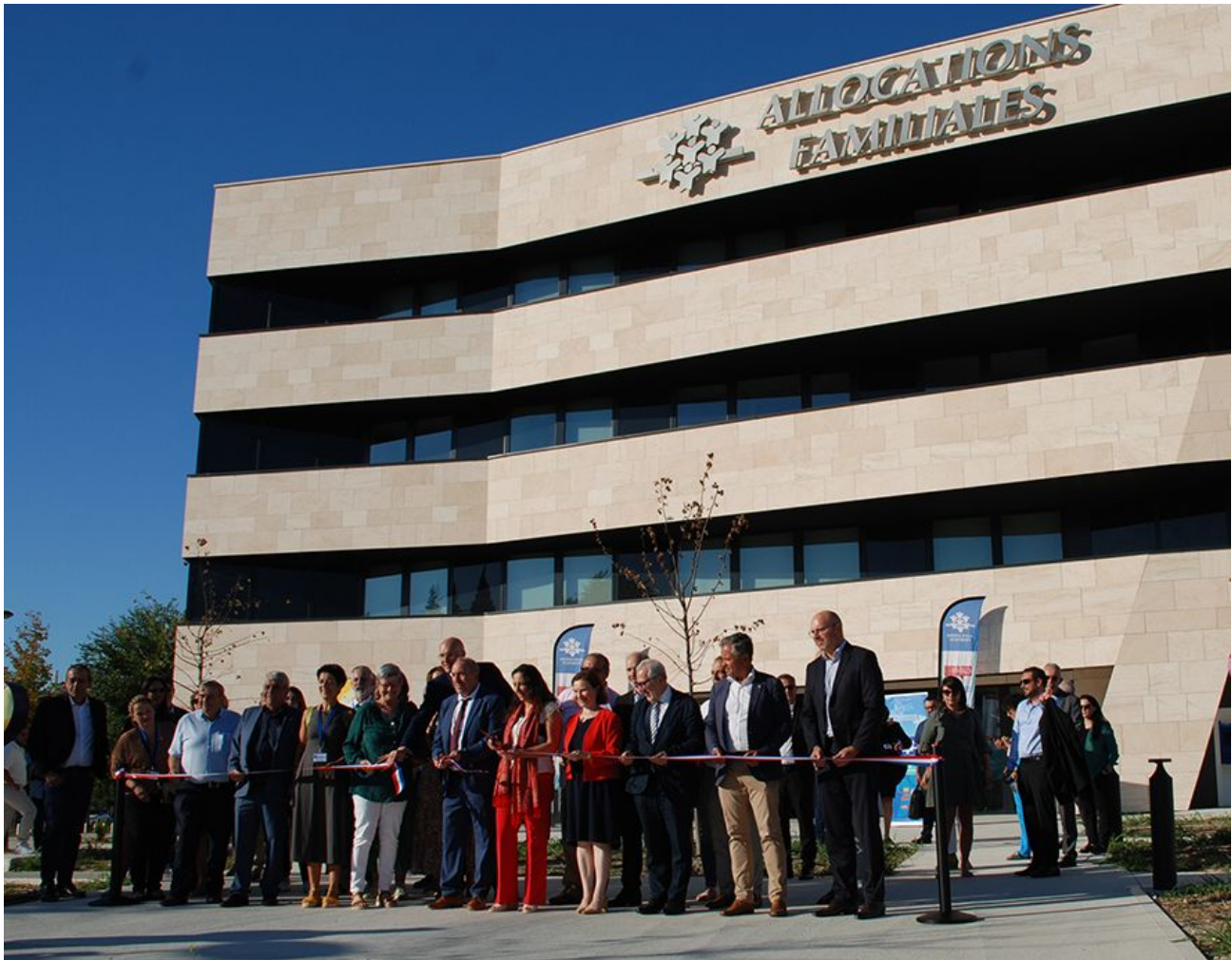
L'inauguration officielle du nouveau siège de la Caf de Vaucluse.