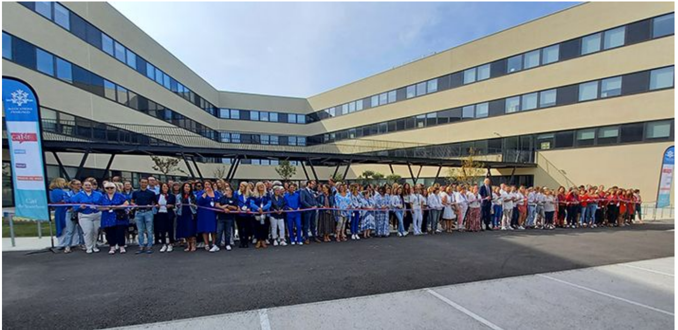
Les agents de la Caf 84 lors de l'inauguration.

Par ailleurs, afin de faciliter l'accès des usagers un parking gratuit et sécurisé est disponible au niveau du boulevard Pierre-Boulle. Le site est aussi desservi par 3 lignes de bus, la 'virgule' ferroviaire de la gare TGV ainsi que plusieurs pistes cyclables.