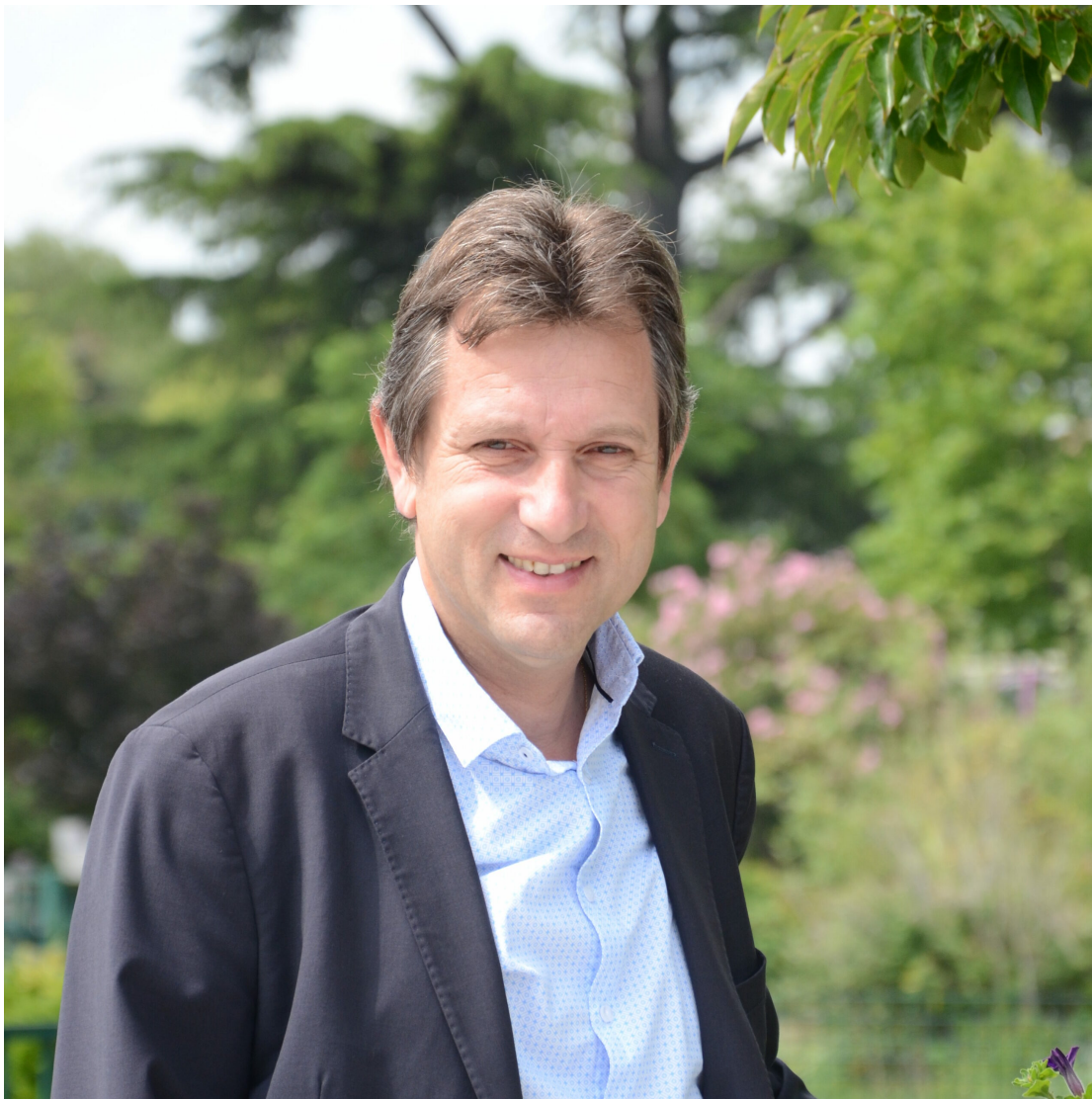
Thierry Lagneau, Maire de Sorgues

Pour Thierry Lagneau , le maire de Sorgues, c'est un aménagement qui respecte la nature et qui est valorisant pour la ville. « C'est une reconversion pertinente et utile », précise-t-il. Au-delà des retombées économiques ce projet semble cocher toutes les cases, à commencer par la réhabilitation d'un lieu qui créait des nuisances de toutes sortes. D'une vilaine cicatrice dans le paysage cette ancienne gravière est devenue un atout pour la ville. Thierry Lagneau, estime qu'il s'agit là « d'un outil de communication et qui apporte de vraies retombées à l'économie locale ». La vélo route, baptisée ViaRhôna , qui relie les berges du lac Léman à celles de la méditerranée, a la bonne idée de passer à toute proximité du lac de la Lionne ce qui peut en faire un gîte d'étape de choix. « Pertinent et utile » disait-il.