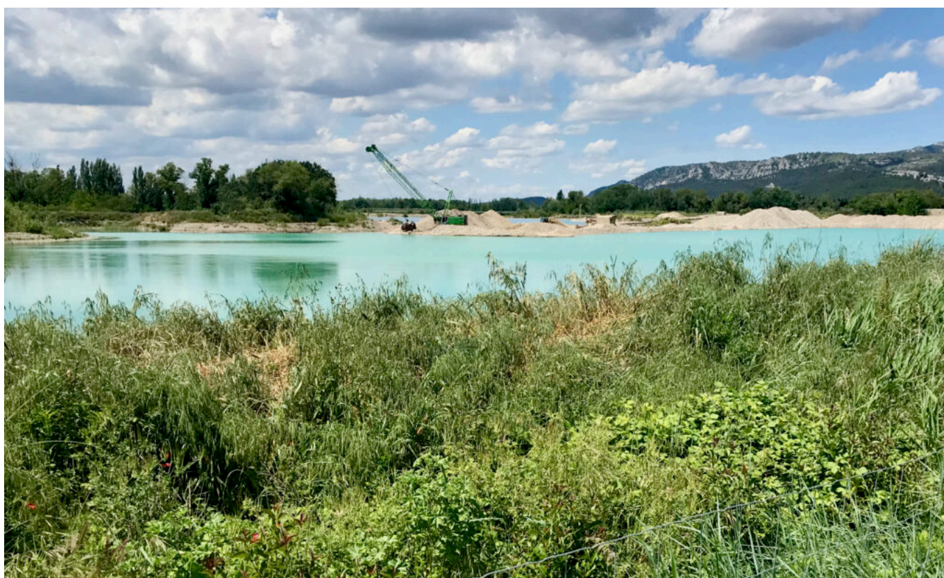
Gravières de Mallemort

L'agence de développement économique Vaucluse Provence Attractivité accompagne la ville de Cheval Blanc dans ce projet qui ressemble, il faut bien le dire, à une course à obstacles.