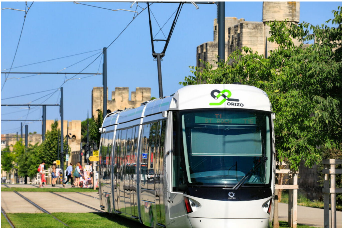
HOCQUEL A - VPA

En raison du pic de pollution d'ozone dû aux fortes chaleurs sur Avignon le réseau de transport Orizo du