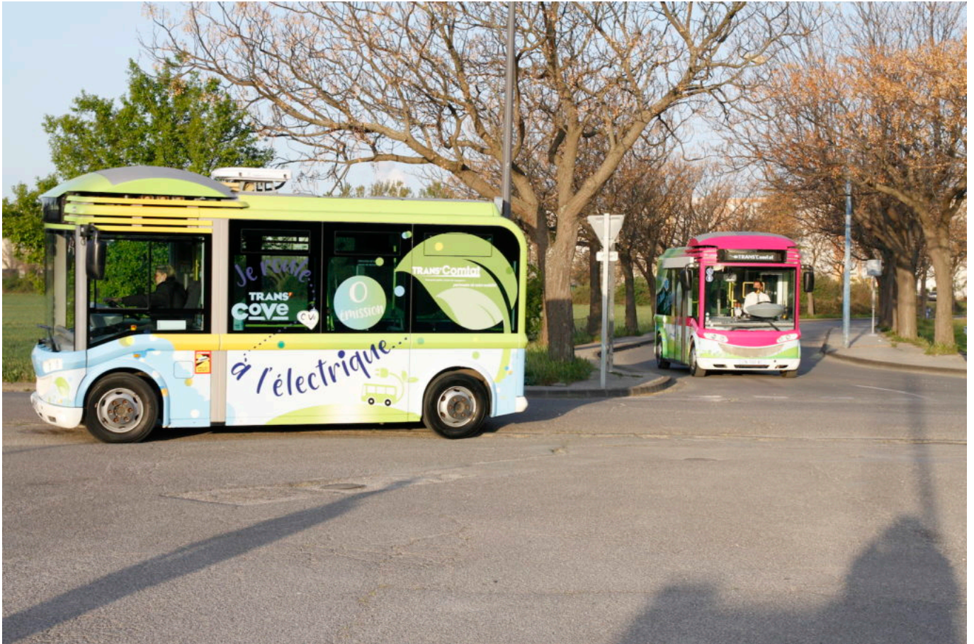
L'expérimentation du 'BlueBus' aura lieu jusqu'au 28 mai prochain.