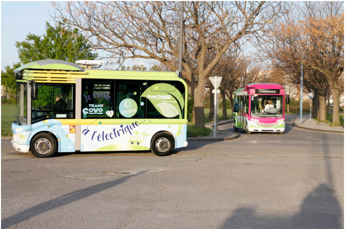
L'expérimentation du 'BlueBus' aura lieu jusqu'au 28 mai prochain.