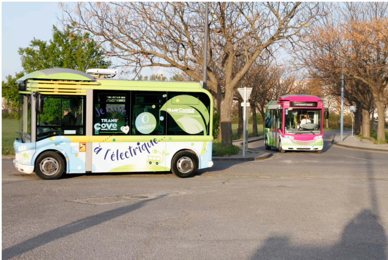
L'expérimentation du 'BlueBus' aura lieu jusqu'au 28 mai prochain.