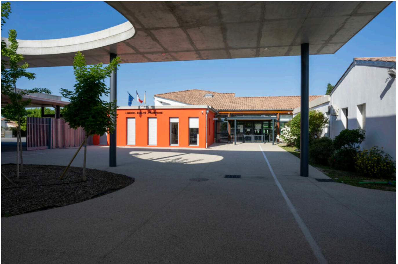
Le collège Pays-de-Sorgues au Thor

L'établissement accueillera bientôt un préau de 350m 2 pour lesquelles les fondations sont déjà terminées et la structure métallique posée pour un montant des travaux estimé à 350 000€.