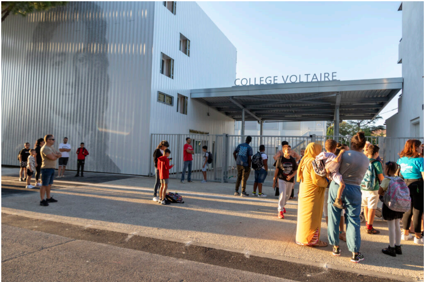
Le collège Voltaire à Sorgues