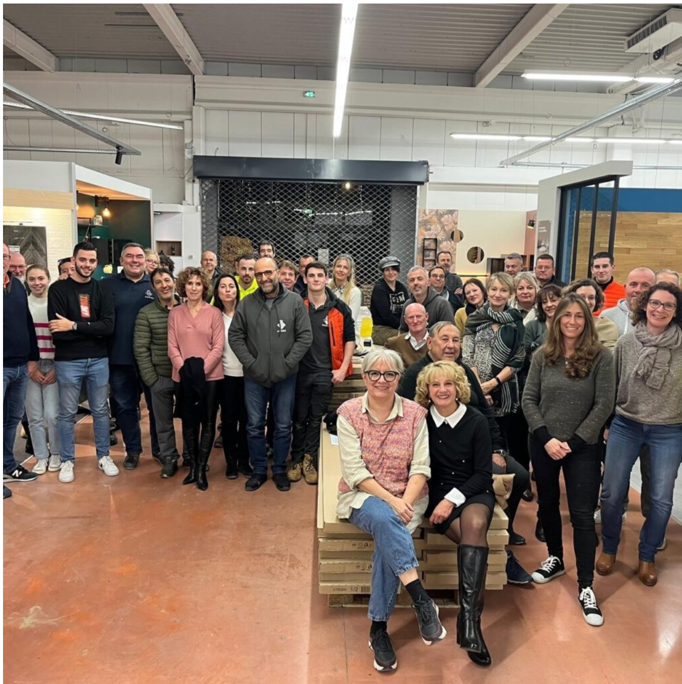
L'équipe Augier.