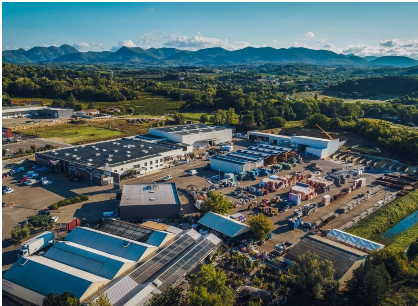
Le site Augier, à Vaison-la-Romaine. ©Augier