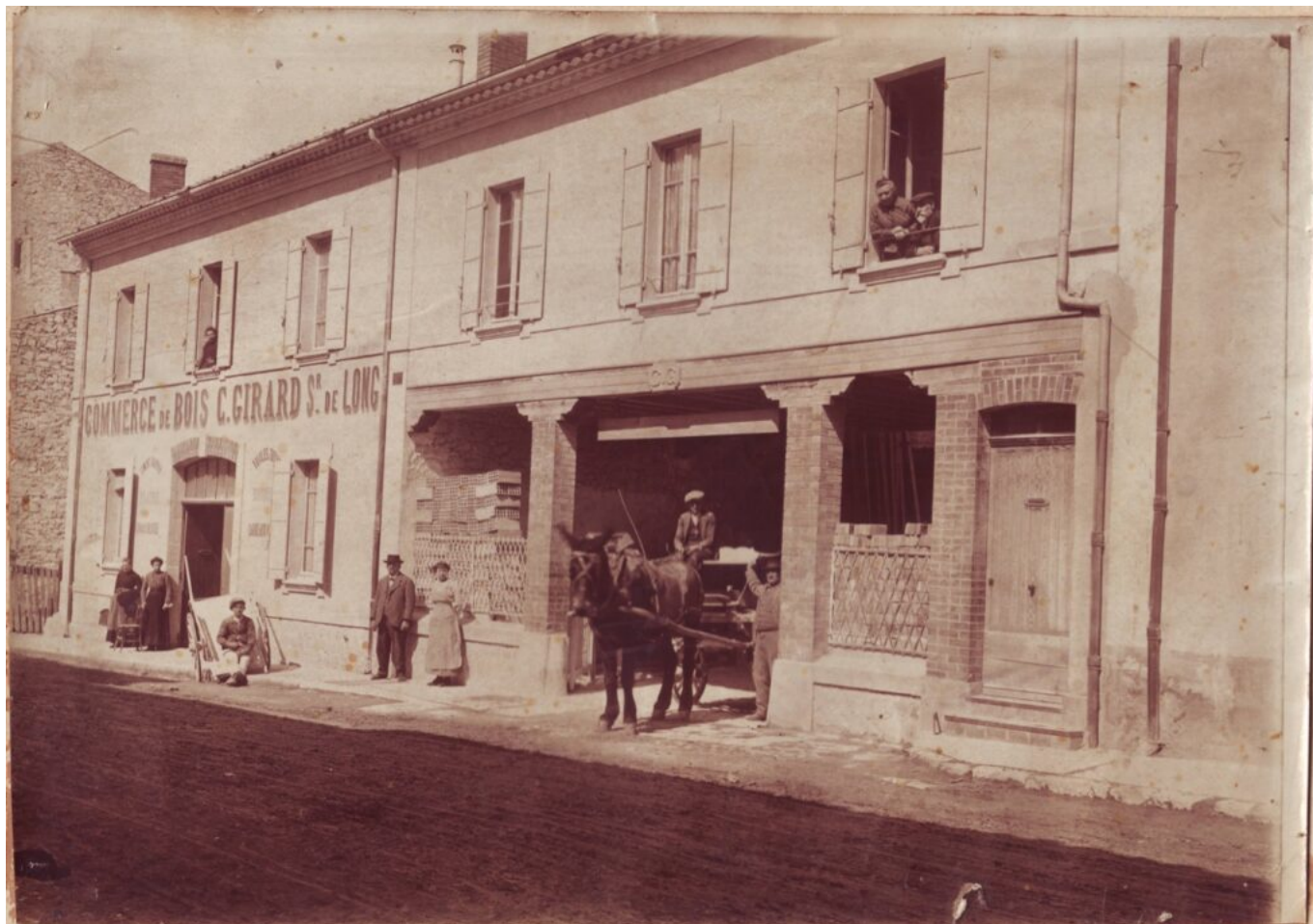
Image d'archives des établissements Benjamin Long.

de l'entreprise ce qu'on connaît d'elle aujourd'hui, à savoir une société pluridisciplinaire, qui maîtrise plusieurs métiers : les matériaux, la menuiserie, le carrelage, le sanitaire, la cuisine et le bricolage.