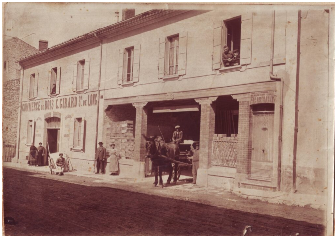
Image d'archives des établissements Benjamin Long.

de l'entreprise ce qu'on connaît d'elle aujourd'hui, à savoir une société pluridisciplinaire, qui maîtrise plusieurs métiers : les matériaux, la menuiserie, le carrelage, le sanitaire, la cuisine et le bricolage.