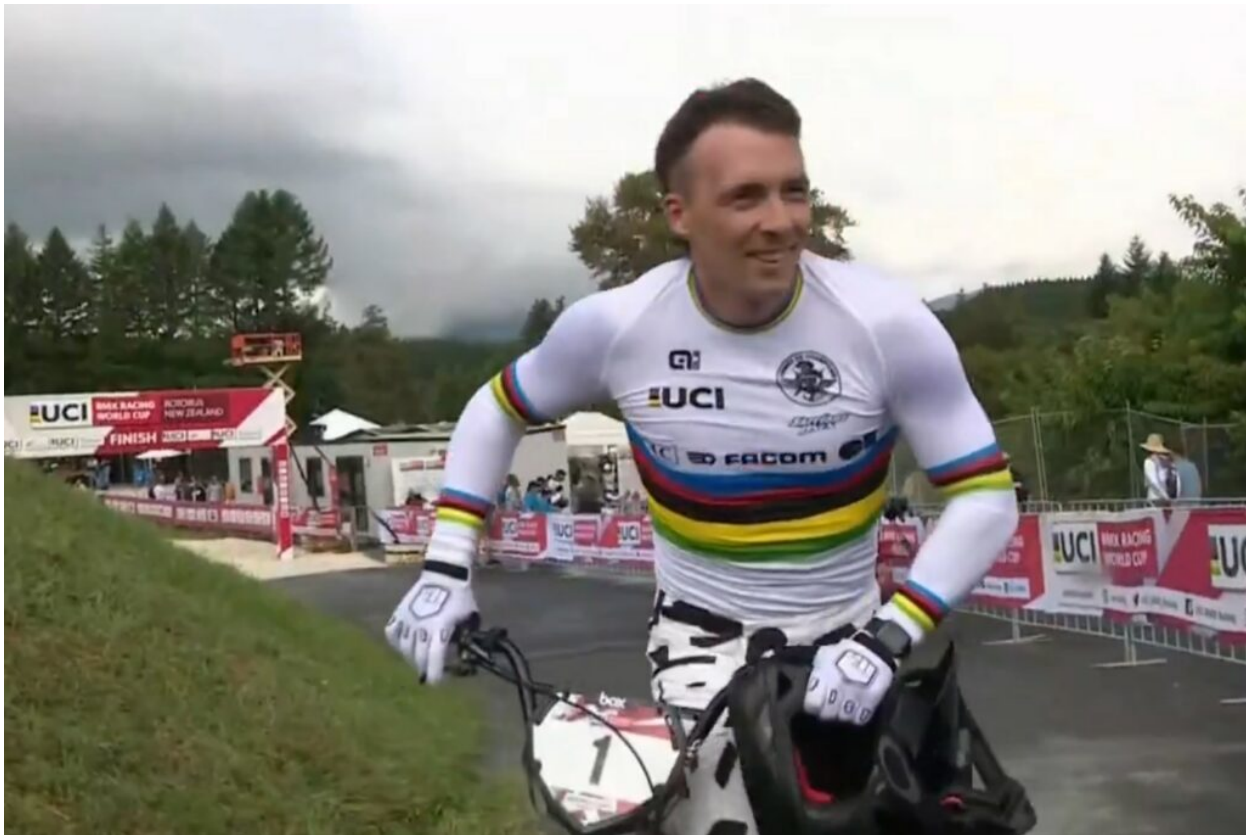
Romain Mahieu juste après avoir remporté la première manche de la coupe du monde 2024 de BMX.