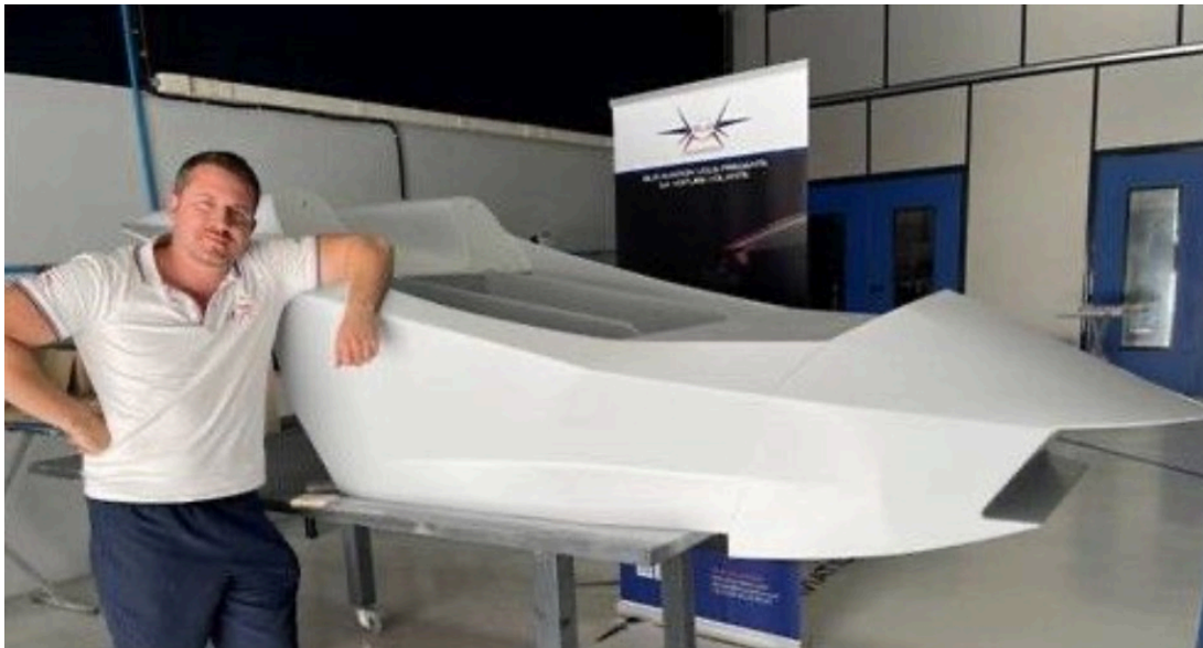
Le moule du châssis.