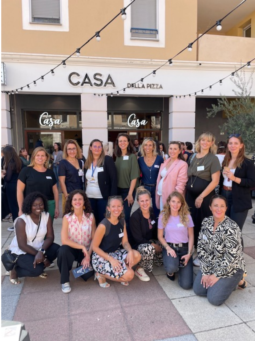
L'équipe de 'Bougeuses' du cercle de Cavaillon.