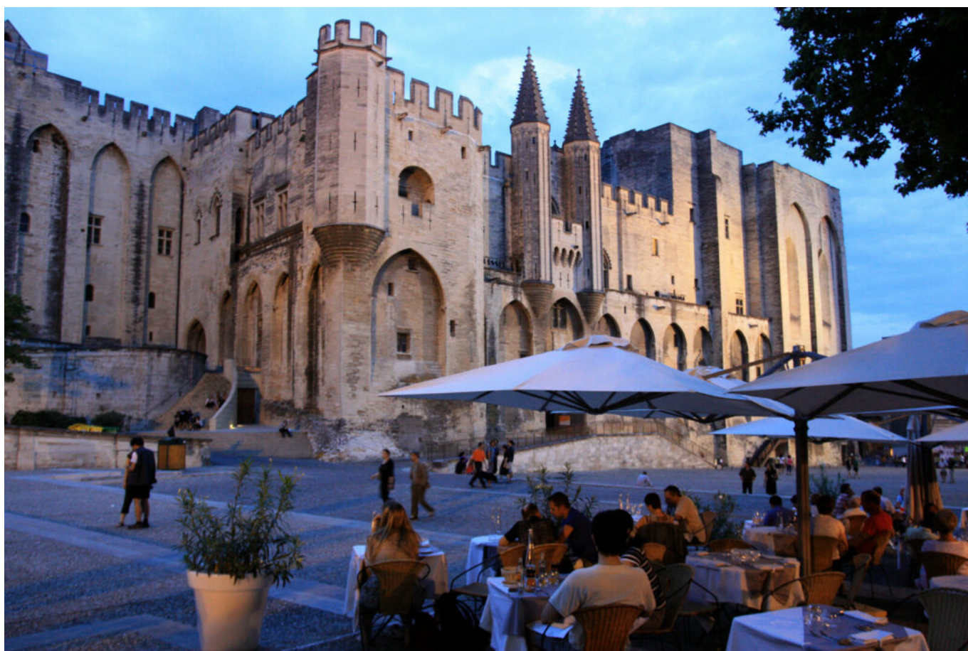
HOCQUEL A - VPA

L'économie régionale bénéficie d'une reprise vigoureuse au second semestre qui lui permet de dépasser les niveaux d'activité de 2019. Mais le doute s'est immiscé dans l'esprit des salariés qui changent d'horizon et des ménages, très hésitants à croquer la pomme.