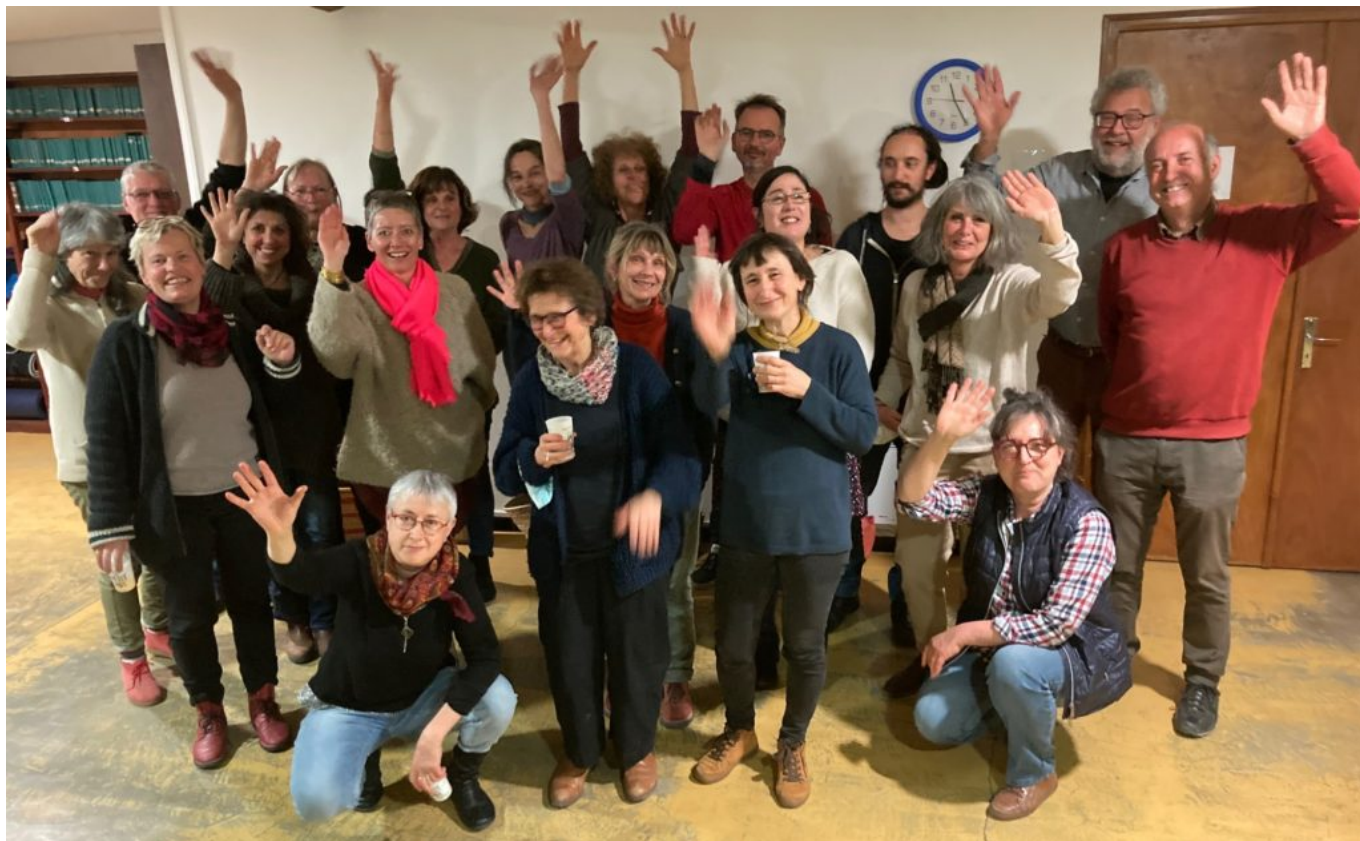
Lles artisans d'art du Réseau Ventoux Métiers d'art