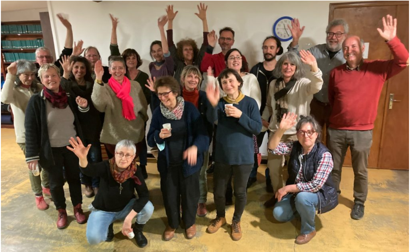
DR Lles artisans d'art du Réseau Ventoux Métiers d'art