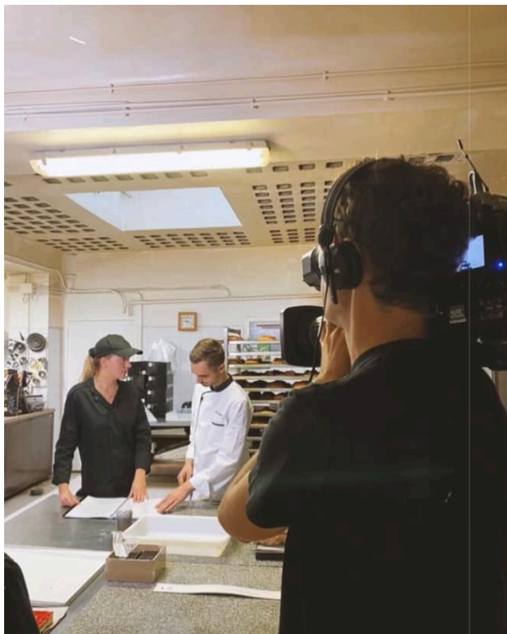
Tournage dans la boulangerie Spiteri à Tarascon.