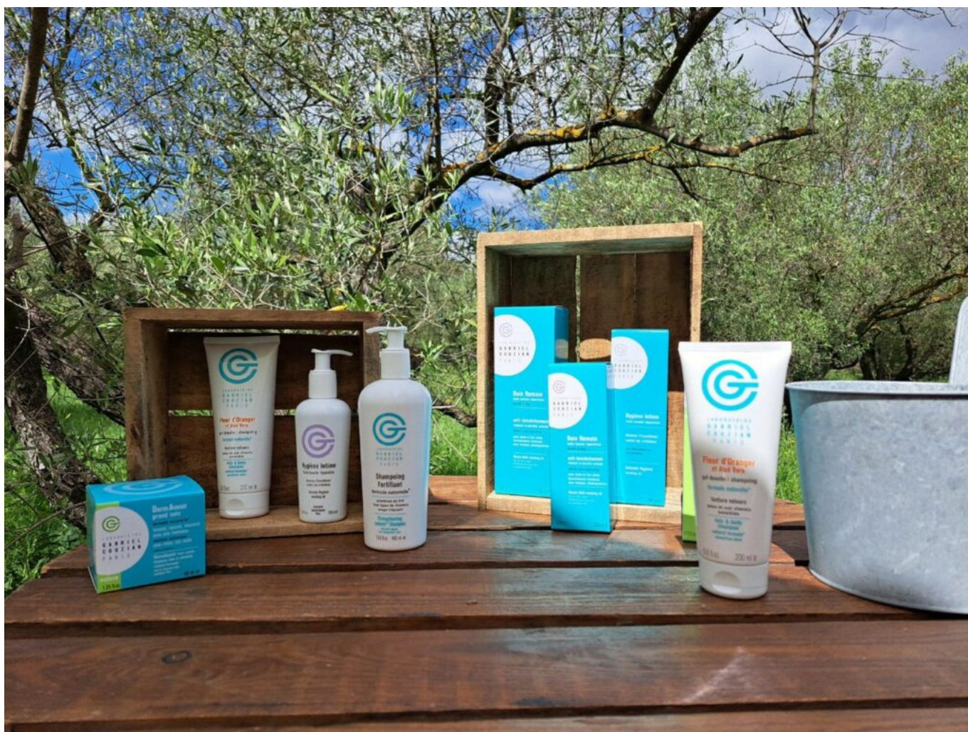
Une partie de la gamme du laboratoire Gabriel Couzian