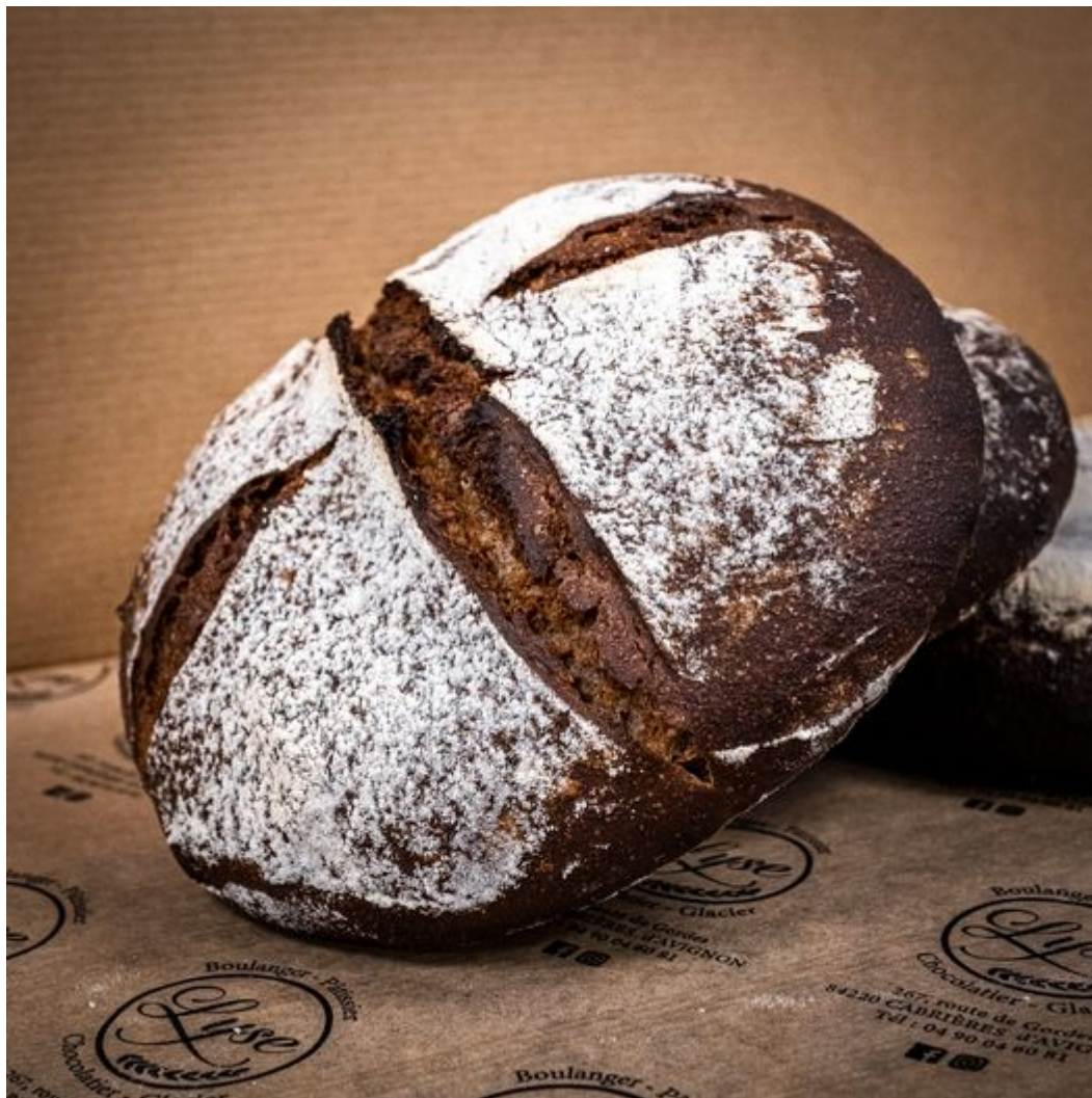
Le pain Châtaigne-noisette de la boulangerie Lyse.