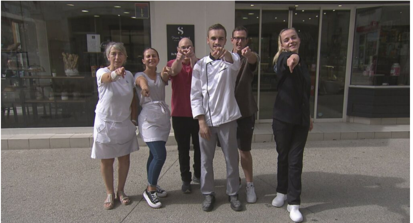
L'équipe de la boulangerie Spiteri.

'La meilleure boulangerie de France' en région Paca. Tous les soirs à 18h35 sur M6. Du lundi 23 au vendredi 27 janvier.