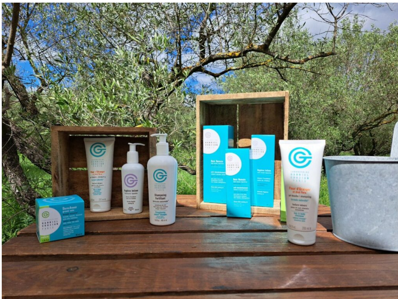
Une partie de la gamme du laboratoire Gabriel Couzian