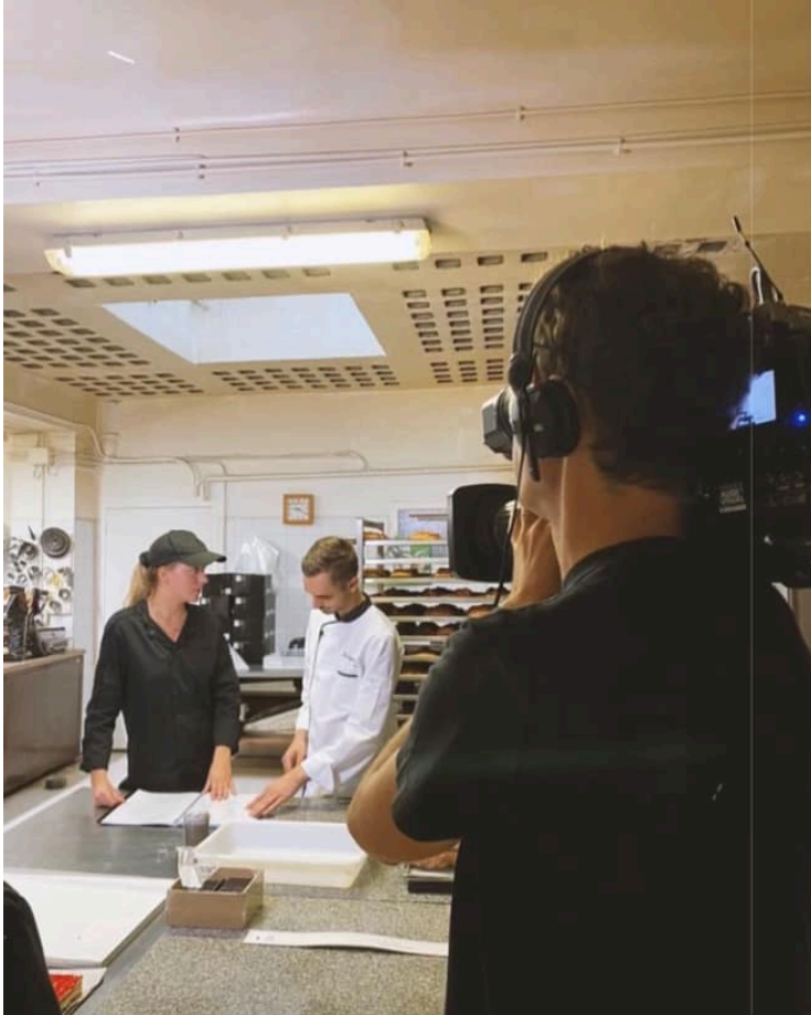
Tournage dans la boulangerie Spiteri à Tarascon.