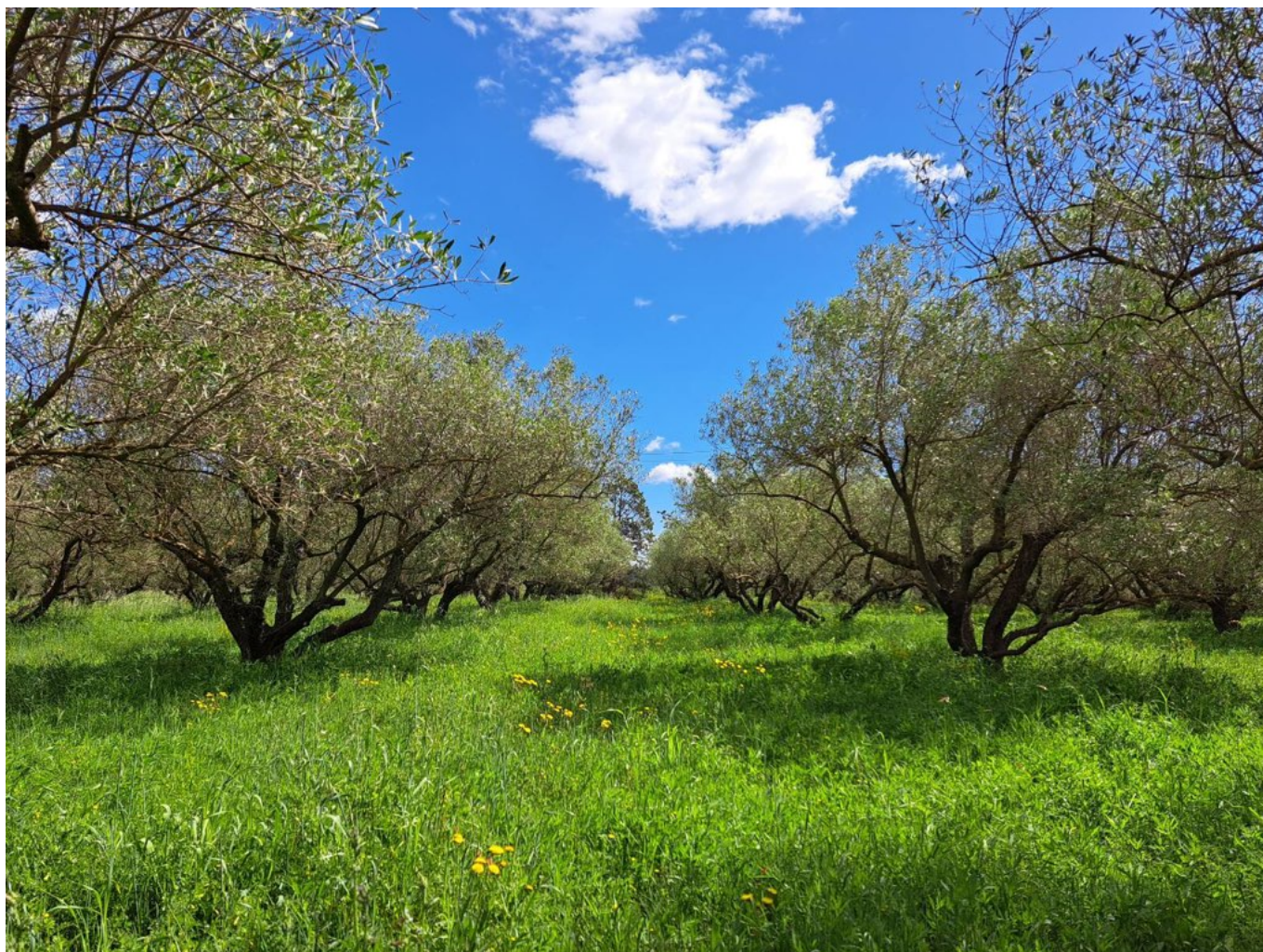
Le Domaine l'Enclos d'Argent ©AB

l'aloë vera et la glycérine, pour les mains, du karité et enfin, figure dans son catalogue un soin »anti-âge » avec de l'extrait de feuilles de Manilkara, un arbre rare de la forêt africaine qui stimule la production d'élastine, lifte la peau et la rend plus lumineuse. Elle a aussi un »Baume à lèvres » 100% végétal miel-coco-grenade qui a obtenu le 1er Prix Psychologie Magazine en 2023.