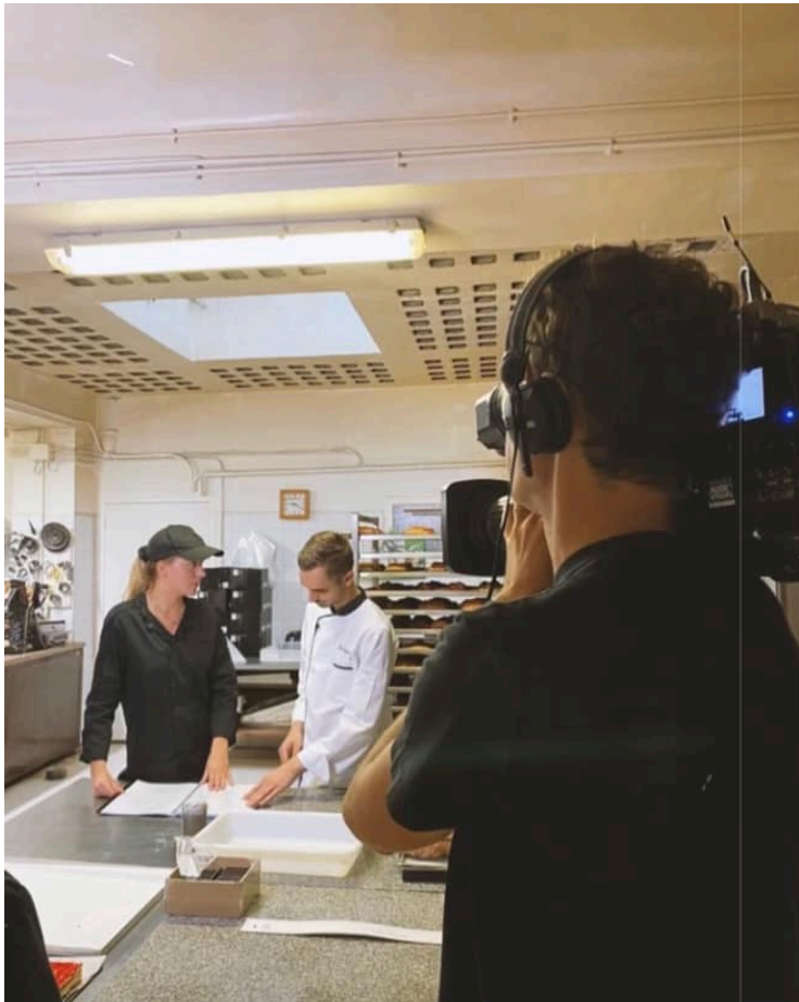
Tournage dans la boulangerie Spiteri à Tarascon.

de 'La meilleure boulangerie' de France, est accompagné par Bruno Cormerais, boulanger et meilleur ouvrier de France en 2004, et Noémie Honiat, cheffe pâtissière, elle aussi ancienne participante de l'émission Top Chef.