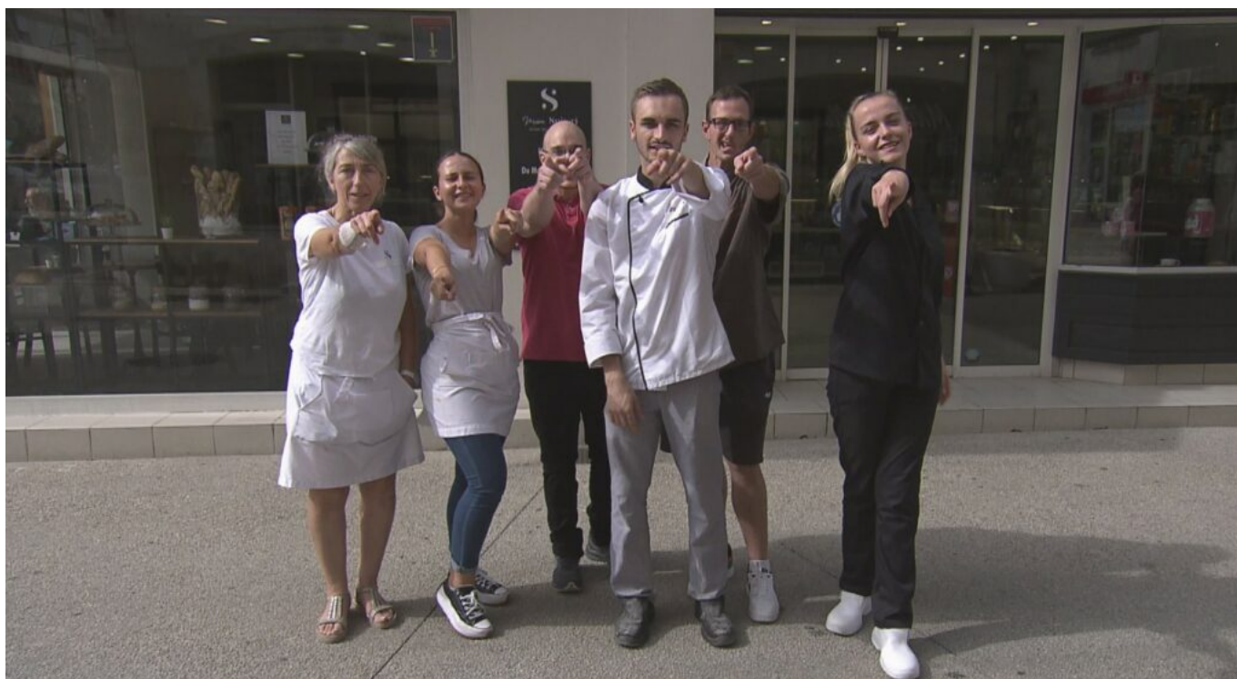
L'équipe de la boulangerie Spiteri.

'La meilleure boulangerie de France' en région Paca. Tous les soirs à 18h35 sur M6. Du lundi 23 au vendredi 27 janvier.