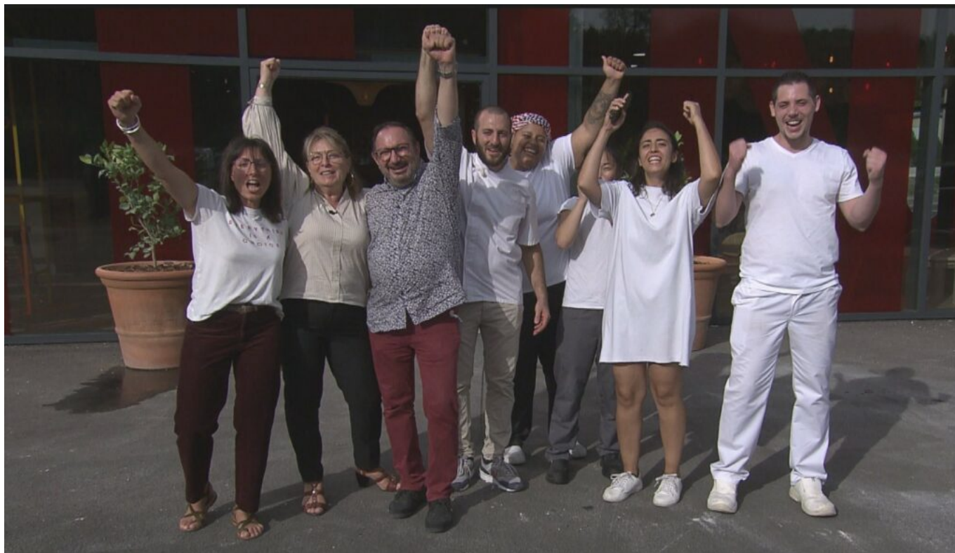
L'équipe de la boulangerie Meinado.