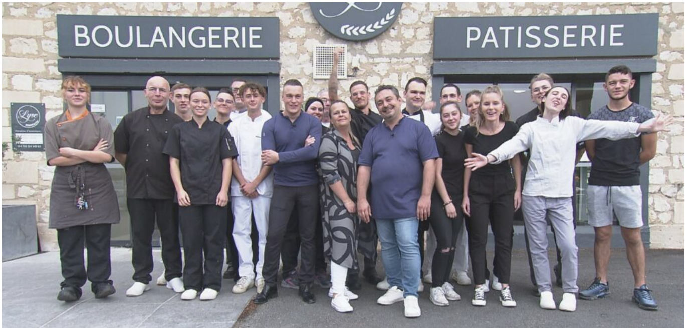
L'équipe de la boulangerie Lyse.