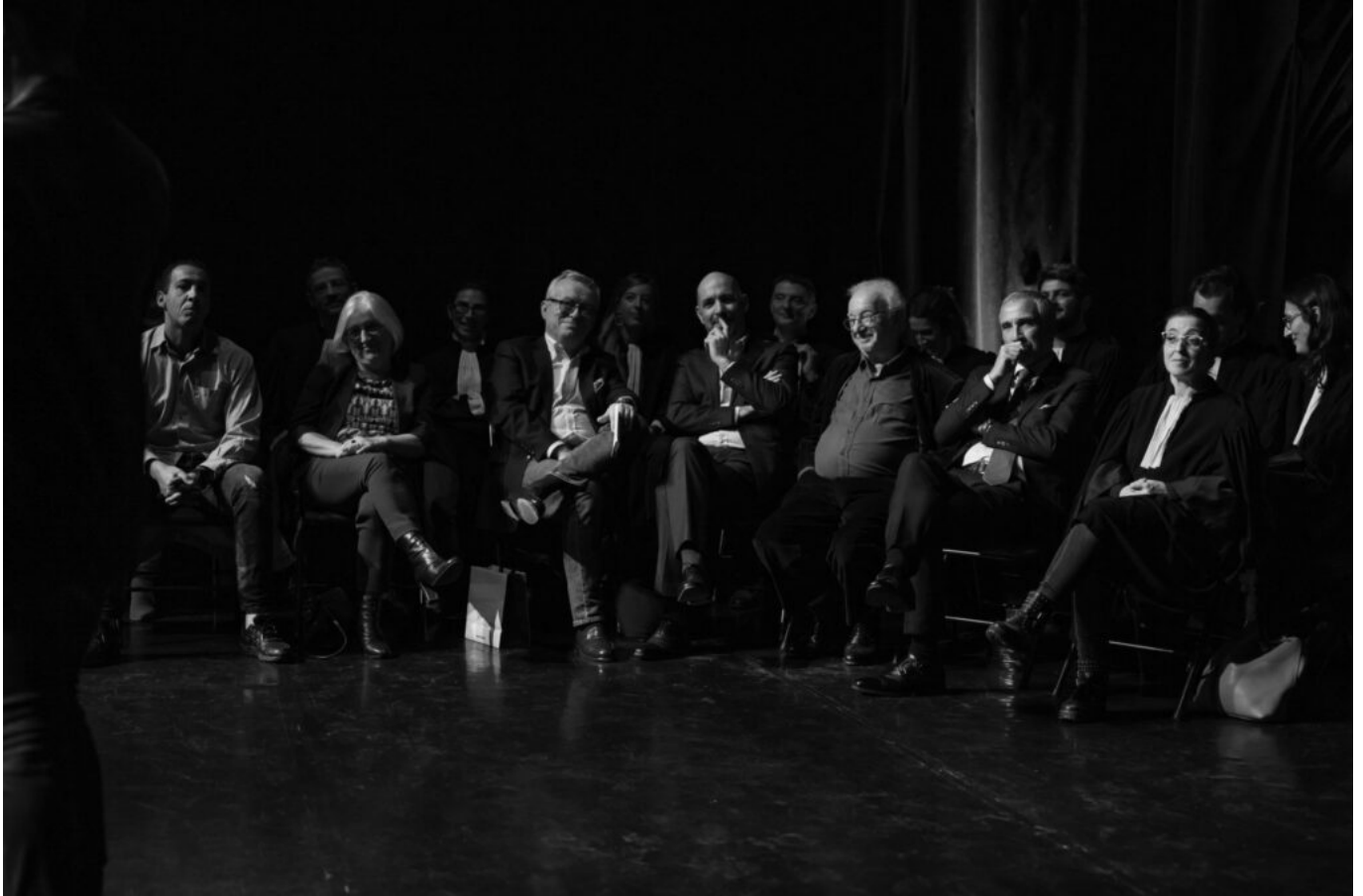
Le Jury.

« Autant de robes noires entourant et soutenant les candidats sur scène. »