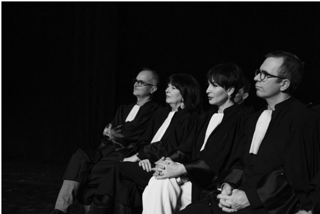
Les bâtonniers.