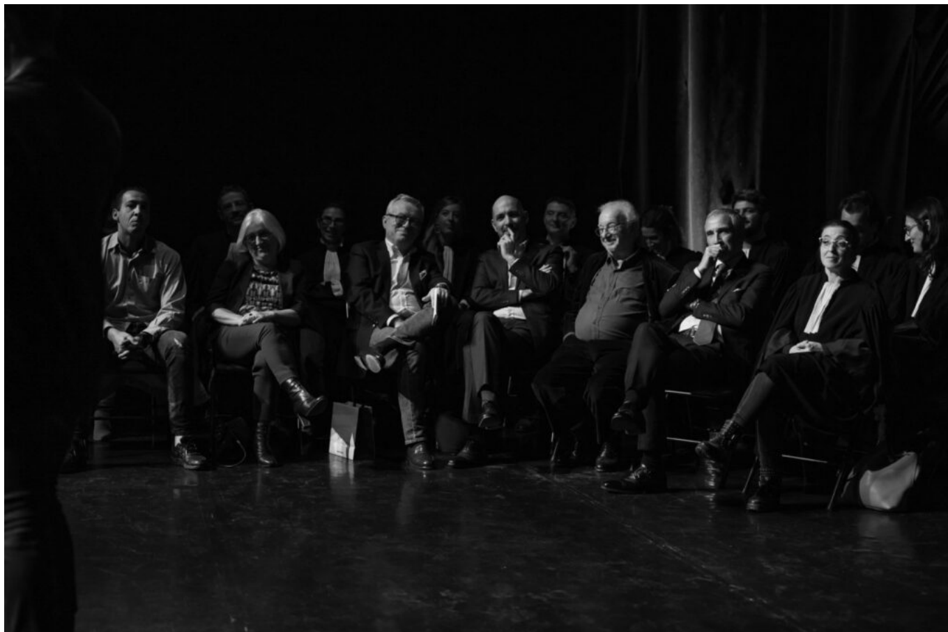
Le Jury.

« Autant de robes noires entourant et soutenant les candidats sur scène. »